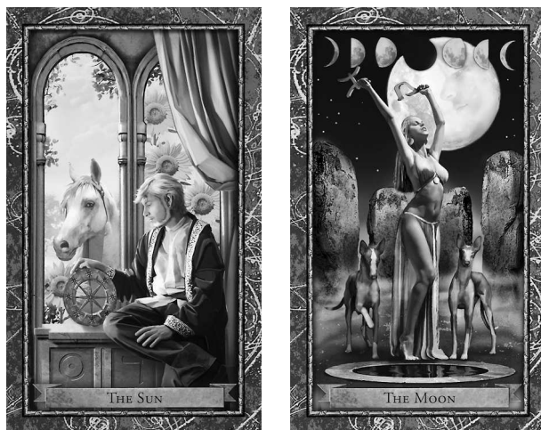
Солнце в Рыбах

Какая карта из Старших Арканов соответствует вашему знаку Солнца? Как две карты — Солнце и его знак — дополняют или отрицают друг друга? Как они описывают вашу личность, индивидуальность и самовосприятие? Что вы можете узнать из своего первого расклада по Таро и астрологии?