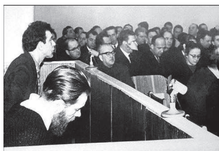
Процесс над Андреем Синявским и Юлием Даниэлем

псевдонимы Абрам Терц и Николай Аржак были раскрыты органами госбезопасности. Обоих писателей-«подпольщиков» арестовали в сентябре 1965 года и предъявили обвинение в «антисоветской агитации и пропаганде» (статья 70 Уголовного кодекса РСФСР). В печати развернулась «разоблачительная» кампания. Но она вызвала совсем