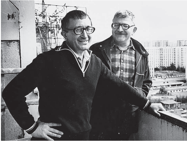
Борис и Аркадий Стругацкие. Москва, 1983 г.

не ежеквартально. Фанфарно отгремел смрадный и отвратительный, как газовая атака, процесс над Синявским и Даниэлем. По издательствам тайно распространялись начальством некие списки лиц, публикация коих представлялась нежелательной. Надвигалось 50-летие ВОСР (Октябрьской революции), и вся идеологическая бюрократия по этому поводу стояла на ушах. Даже самому изумрудно-зеленому оптимисту ясно сделалось, что „Оттепель“ „прекратила течение свое“ и пошел откат, да такой, что впору было готовиться сушить сухари... Сегодняшний читатель просто представить себе не может, каково было нам, шестидесятникам-семидесятникам, как беспощадно и бездарно давил литературу и культуру вообще всемогущий партийно-государственный пресс, по какому узенькому и хлипкому мосточку приходилось пробираться каждому уважающему себя писателю: шаг вправо — и там поджидает тебя семидесятая (или девяностая) статья УК, суд, лагерь, психушка, в лучшем случае, занесение в черный список и выдворение за пределы литературного процесса лет эдак на десять; шаг влево — и ты в объятиях жлобов и бездарей, предатель своего дела, каучуковая совесть, иуда, считаешь-пересчитываешь поганые сребреники... Сегодняшний читатель понять этих дилемм, видимо, уже не в состоянии...»