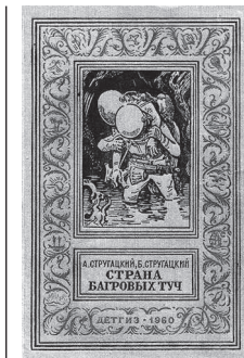
Обложка второго издания повести «Страна багровых туч». 1960 г.