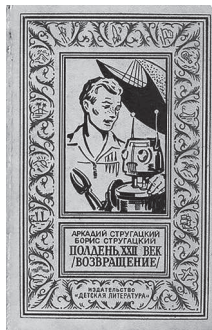
Обложка первого издания романа «Полдень, XXII век (Возвраще- ние)». 1967 г.