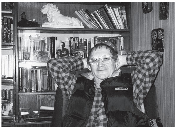
Борис Стругацкий. 1998 г.

советовал: попробуйте мат-мех, там же есть астрономия, а мальчик астрономией интересуется... И я пошел на мат-мех. Там я тоже оказался в толпе медалистов, но на сей раз благополучно поступил, без всяких трудностей, если не считать того обстоятельства, что меня предварительно основательно помучили — вызвали на собеседование самым последним. Впрочем, все это уже были совершенные пустяки. Я не очень горевал, оставшись без своей ядерной физики: как-никак, астрономия тоже была моей любовью, пусть даже и второй, и впоследствии занимался я астрономией и математикой с большим удовольствием и прилежанием» 1 .