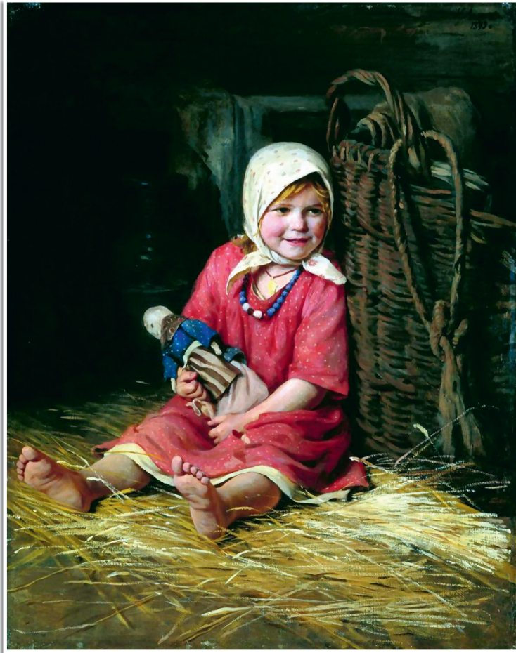
К. Лемох «Варька», 1893.

то выпадала честь спасать из плена. И уже тогда пытливые девичьи глазки высматривали себе суженого — надёжного, смелого, находчивого, сообразительного, ловкого. А мальчишки безусые, безбородые и рады были стараться!