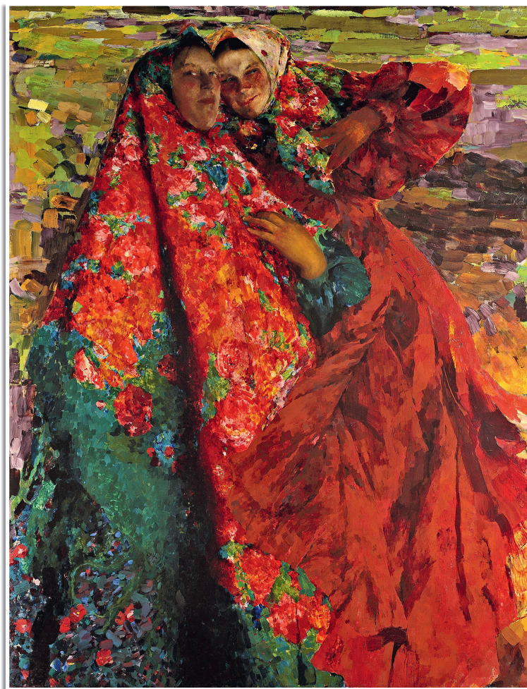
Ф. Малявин «Бабы», 1905.

Насколько эта книга современна, решать только тебе, мой дорогой читатель. Но если ты прочтёшь её, как говорят, на одном дыхании, если будешь всматриваться в многочисленные (я не поскупилась!) репродукции картин известных художников, которые во многом подтверждают мой рассказ, и раз за разом открывать для себя всё новые и новые детали, то уверена, что мы с тобой нашли друг друга. Значит, книге — жить. Значит, книге — радовать. Значит, книге — быть полезной для тебя, живущего в XXI веке.