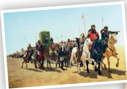
В крестовом походе: Ричард впереди в красной одежде.