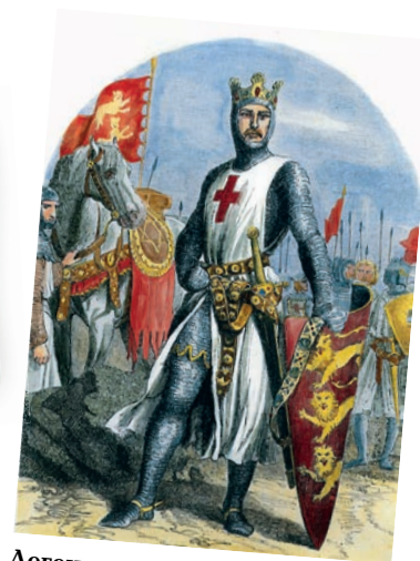
Легендарный и гордый: английский король Ричард Львиное Сердце.

Каким-то необычным был этот странник: внушительного роста, говорит на изысканном французском языке и ведёт себя надменно. Его спутники относились к нему не как к равному, а с большим почтением — возможно, это именно он: знаменитый Ричард Львиное Сердце! Нужно срочно сообщить герцогу, что он здесь!