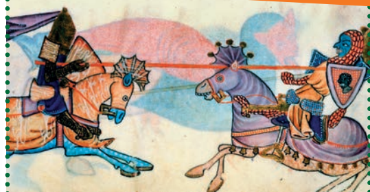
Ричард Львиное Сердце в бою с султаном Салах ад-Дином.

Ричард Львиное Сердце сохранил авторитет и достоинство. Теперь он освобождён и возвращается в Англию.