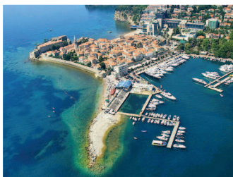
Старый город Будвы

Отправьтесь из Будвы в южном направлении. Вас ждет старейший в Черногории приморский город Ульцинь (▷ 46) с его крепостью. При желании можете проехать дальше, на так называемый Большой пляж – 12-километровую песчаную полосу, а на обратном пути заглянуть в магазины города Бар (▷ 58), а также посетить заброшенный средневековый Стари Бар (▷ 44).