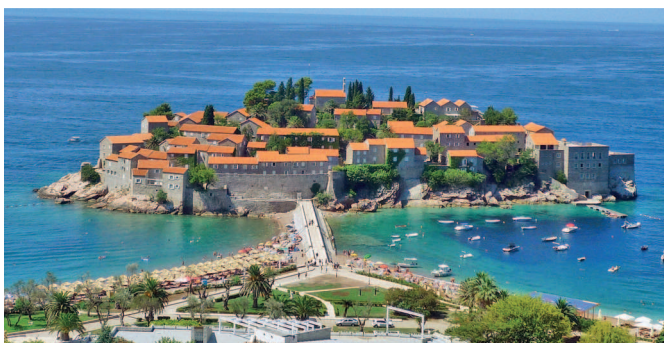
Остров Свети-Стефан — символ черногорского побережья

Исходя из всего вышесказанного, Черногория является идеальным местом для летнего отдыха россиян на море, выигрывая у Болгарии живописностью и разнообразием природы, у Турции – более привычной для нас славянской речью местного населения, а у Хорватии – ценами.