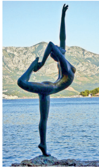
Символ Будвы скульптура — «Танцовщица из Будвы»