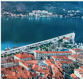
Вид на Бока-Которский залив