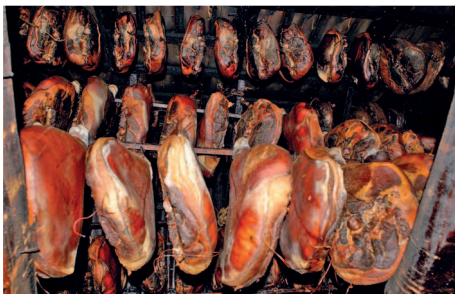
Ветчина пршут в Негуши

Познакомьтесь с черногорской историей, религией и культурой. В Цетинском монастыре вы можете поклониться деснице Иоанна Крестителя. В Цетине (▷ 72) вам также надо зайти в Национальный музей Черногории (▷ 74) и прогуляться по центральным улицам города, застроенным красивыми особняками начала XX века. Можно также проехать в горную деревню Негуши (▷ 76), где производят знаменитый черногорский деликатес – ветчину пршут.