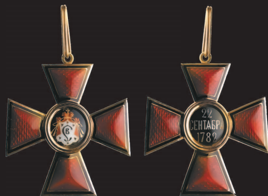
Знак ордена Святого Владимира I или II степени (аверс и реверс).

Кавалеры I степени имели знаки: крест на ленте, надетой через правое плечо, и звезду на левой стороне груди; II степени — такой же крест на шее и звезду, награжденные III степенью носили крест меньших размеров на шее, а IV — крест в петлице (на груди).