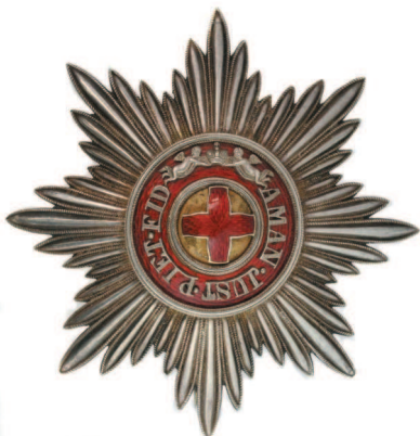
Звезда ордена Святой Анны. Серебро, золочение, 90 мм. 1906—1908 гг.

а на престол возшла его супруга, ставшая Екатериной Великой. После смерти Екатерины II императором стал сын ее и Петра III Павел. В день своей коронации, 5 апреля 1797 г., он причислил орден Святой Анны к государственным орденам Российской империи. В 1829 г. вышел первый статут (устав) ордена.