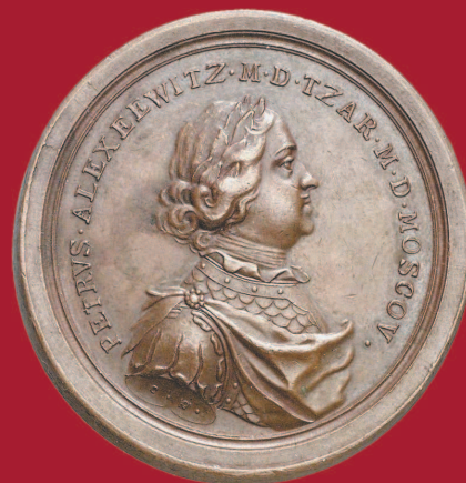
Аверс варианта унтер-офицерской медали «За Полтавскую баталию» с надписью на латыни.

Устное распоряжение о награждении участников Полтавского сражения медалями было сделано вскоре после этого события. Но официальный указ об их изготовлении последовал лишь в феврале 1710 г., причем в нем речь шла только о серебряных наградах для низших чинов — рядовых, капралов и урядников (унтер-офицеров) гвардейских Преображенского и Семеновского полков. Было решено чеканить серебряные полтавские медали двух видов: урядничьи (унтер-офицерские), весом в 19 золотников (весовая мера: 1 золотник равняется 4,266 г) ценою 3 руб. 74 коп. «против двухмесячной дачи», и солдатские, весом в 10 золотников ценою в 1 рубль, равнявшиеся двум средним месячным солдатским жалованиям. Из купленных для этой цели 20 пудов серебра было отчеканено 4618 медалей.