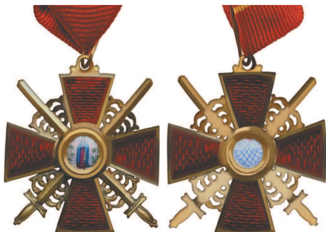
Крест ордена Святой Анны III степени с мечами за военные заслуги (аверс и реверс). 35 × 35 мм.

Ко времени, когда герцог Карл Петер Ульрих приехал в Россию, кавалерами ордена Святой Анны были всего два человека (сам герцог и его покойный отец). В феврале 1742 г. к ним прибавились четыре русских кавалера — камергеры М. И. Воронцов, А. Г. Разумовский, братья А. И. Шувалов и П. И. Шувалов. В апреле того же года кавалеров ордена стало уже семь. Когда же Петр Федорович был провозглашен императором Петром III (25 декабря 1761 г.), орденом святой Анны были награждены уже десятки российских подданных.