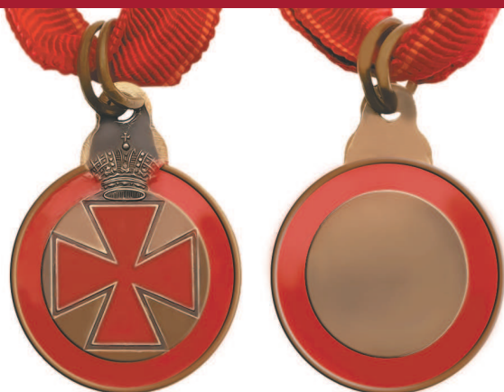
Аннинская медаль — Знак отличия ордена Святой Анны (аверс и реверс).

Первым орденом, к которому был представлен будущий великий полководец А. В. Суворов, стал как раз орден Святой Анны. Эту же награду еще при императрице Елизавете Петровне получил отец Суворова. В 1789 г. ордена Святой Анны удостоился будущий победитель Наполеона М. И. Кутузов.