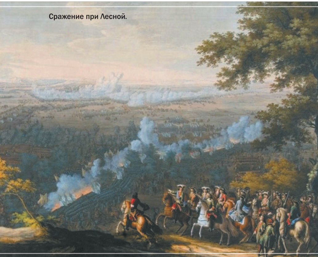
Сражение при Лесной.

С медалью «За победу при Лесной» связан важный эпизод Северной войны между Россией и Швецией — разгром 16-тысячного корпуса генерала А. Левенгаупта 28 сентября 1708 г. у деревни Лесная. Благодаря этому успеху удалось значительно ослабить военный потенциал армии короля Карла XII и в дальнейшем разбить ее.