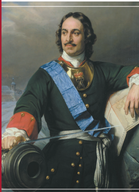
Петр I в форме офицера лейб-гвардии Преображенского полка.

Орден Андрея Первозванного появился в России в тот период, когда Петр I создавал новое российское государство. Одним из его атрибутов стала наградная система. До Петра ее в России не существовало. 20 марта 1699 г. он учредил первый российский орден — Святого апостола Андрея Первозванного. Это была высшая награда в Российской империи до 1917 г., когда им прекратили награждать.