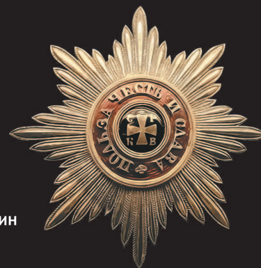
Звезда ордена Святого Владимира (один из вариантов исполнения).