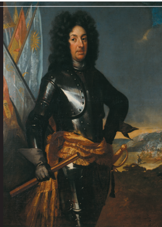
Генерал Адам Людвиг Левенгаупт.