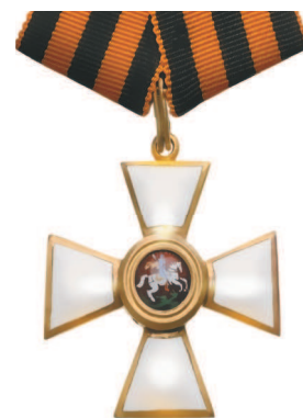
Орден Святого Георгия IV степени.

предусматривал строго последовательного, от низшей степени к высшей, награждения. А потому часто за особые заслуги представляли к высшим степеням, минуя низшие. Орден давался только за особые отличия в сражениях, а также за выслугу: в офицерских чинах — 25 лет в полевой службе или 18 кампаний в морской (с 1833 г. — при условии участия хотя бы в одном сражении).