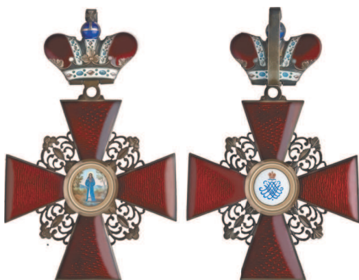
Крест ордена Святой Анны с короной I степени (аверс и реверс). Позолоченное серебро, 84 × 54 мм.