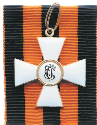
Крест ордена Святого Георгия (аверс и реверс).