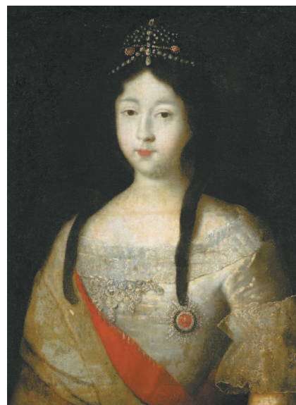
Великая княгиня Анна Петровна.

Орден учрежден в 1735 г. и назван в честь дочери царя Петра I Анны ее мужем Карлом Фридрихом, герцогом из немецкой династии Готторпов, правивших в исторической области Гольштейн.