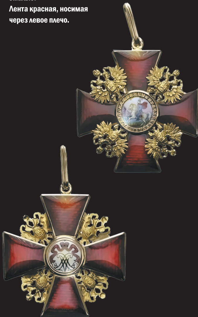
Крест ордена (аверс и реверс).

Лента красная, носимая через левое плечо.