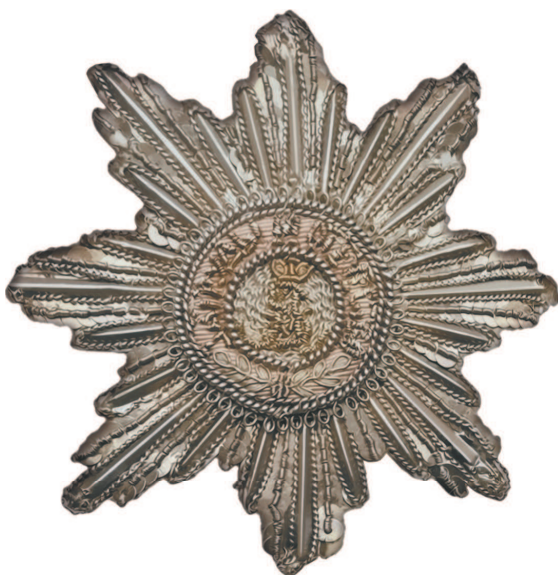
Шитая звезда ордена А. Невского. Первая половина XIX в.

21 мая 1725 г., когда старшая дочь Петра и Екатерины Анна выходила замуж за герцога Гольштейнского, императрица вручила знаки ордена Святого Александра Невского мужу дочери и некоторым гостям. В их числе были военные и штатские люди — всего 15 человек. 30 августа того же года, в День святого Александра Невского, кавалером ордена стала сама Екатерина I. Помимо того, вместе с царицей были награждены 22 человека, в числе которых король Польши Август II и датский правитель Фредерик IV. Кавалерами ордена Святого Александра Невского были также генерал-поручик П. А. Румянцев, знаменитый арап Петра Великого генерал-аншеф А. П. Ганнибал, полководец А. В. Суворов.