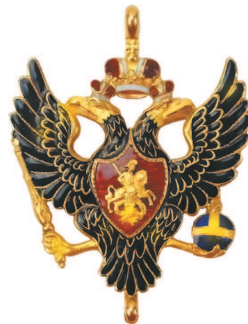
Звено орденской цепи.

За время царствования Петра I (до 1725 г.) орденом Святого апостола Андрея Первозванного были пожалованы 38 человек. Его преемники этой наградой жаловали нечасто. Правда, императрица Екатерина I Алексеевна (1684—1727) за 2 года и 3 месяца своего царствования наградила 18 человек, т. е. по 9 в год. Дочь Петра I Елизавета Петровна (1709—1762) за 20 лет правления пожаловала орден 83 подданным. При Екатерине II (1729—1796) за 33 года ее царствования орден пожаловали 100 подданным.