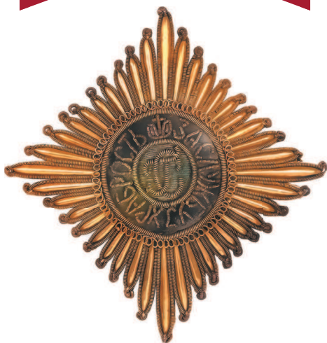
Шитая звезда ордена Святого Георгия. Изготовлена из латунной позолоченной нити. Размер — 68 × 69 см, вес — 20,8 г. Середина XIX в.

Орден Святого Георгия учрежден императрицей Екатериной II 7 декабря 1769 г., через год после начала Русско-турецкой войны. Являлся высшей военной наградой Российской империи. Она же возложила на себя знаки первого ордена Святого Георгия I степени. Проект ордена разработал герой Семилетней войны (1756–1763) генерал-фельдмаршал граф З. Г. Чернышев.