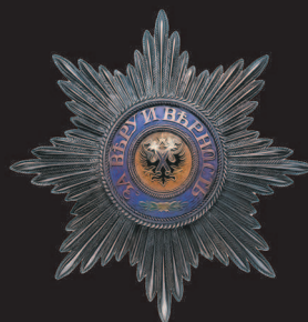
Звезда ордена. Вторая половина XIX в.