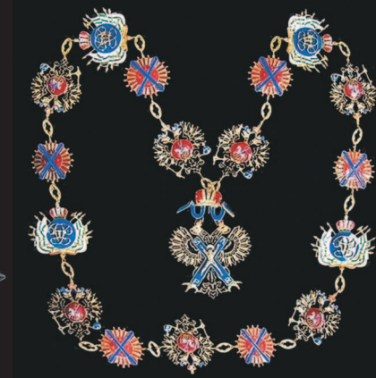
Цепь и знак Императорского ордена Святого апостола Андрея Первозванного.