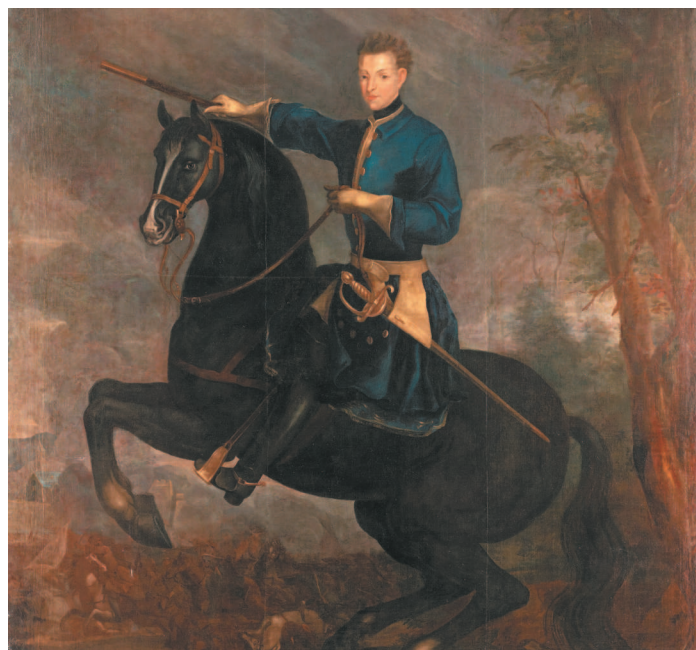
Король Швеции Карл XII.