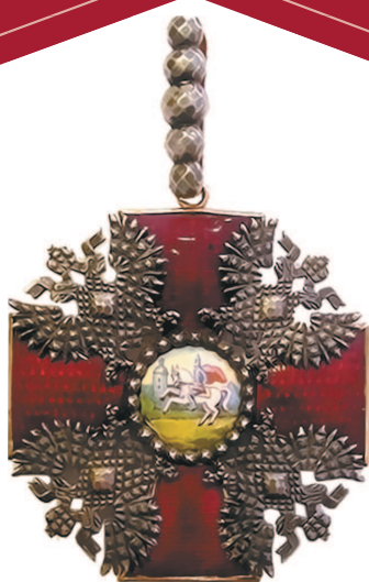
Крест ордена Святого Александра Невского.

Орден был задуман Петром I. Он рассчитывал, что награда будет вручаться только за военные подвиги. Еще в 1722 г., за три года до смерти царя, были отчеканены орденские знаки и изготовлены алые орденские ленточки. Но учредить награду Петр так и не успел. Сделала это его супруга, императрица Екатерина I, 21 мая 1725 г. Она решила использовать этот орден также для поощрения гражданских лиц.