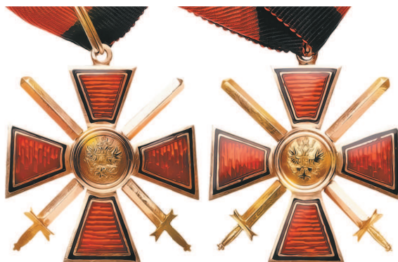
Варианты ордена Святого Владимира для нехристиан.

Составитель знаменитого «Толкового словаря живого великорусского языка», которым широко пользуются и сейчас, В. И. Даль был кавалером ордена Святого Владимира с бантом и бриллиантами.