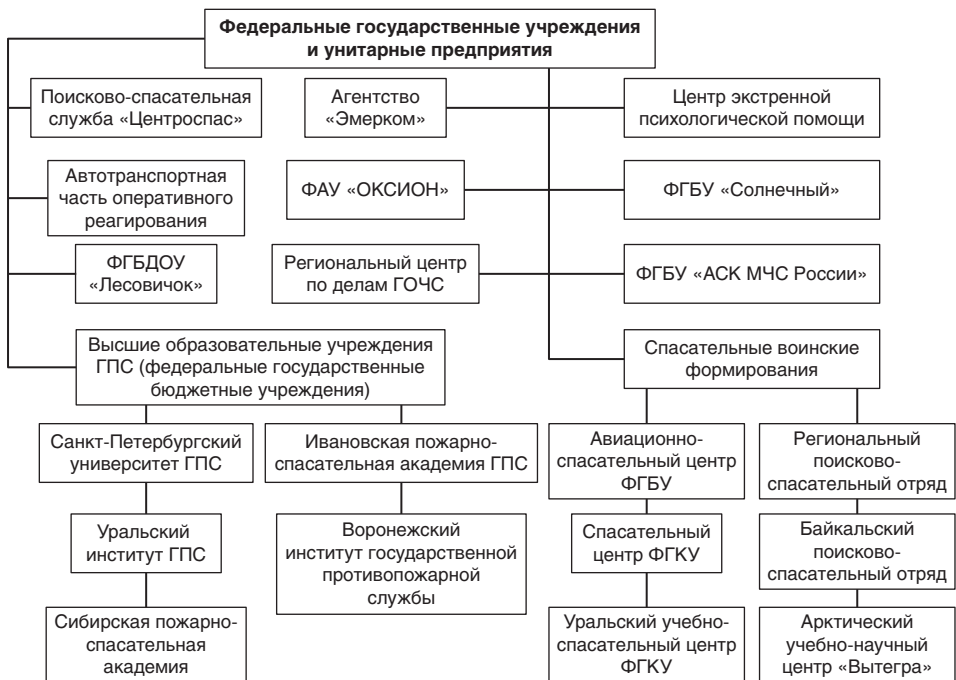
Рис. 1.1. Структура Министерства Российской Федерации по делам гражданской обороны, чрезвычайным ситуациям и ликвидации последствий стихийных бедствий (федеральные государственные учреждения и унитарные предприятия): ГОЧС — гражданская оборона и чрезвычайные ситуации; ГПС — государственная противопожарная служба; УНЦ — учебно-научный центр; ФАУ — федеральное автономное учреждение; ФГБДОУ — федеральное государственное бюджетное дошкольное образовательное учреждение; ФГБУ — федеральное государственное бюджетное учреждение; ФГКУ — федеральное государственное казенное учреждение

В настоящее время структура Министерства Российской Федерации по делам гражданской обороны, чрезвычайным ситуациям и ликвидации последствий стихийных бедствий представлена на рис. 1.1–1.3 (Центральный аппарат МЧС России, федеральные государственные учреждения и унитарные предприятия и центры управления в кризисных ситуациях).