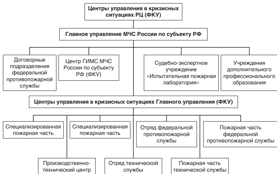
Рис. 1.2. Структура Министерства Российской Федерации по делам гражданской обороны, чрезвычайным ситуациям и ликвидации последствий стихийных бедствий (центры управления в кризисных ситуациях): ГИМС МЧС — Государственная инспекция по маломерным судам Министерства Российской Федерации по делам гражданской обороны, чрезвычайным ситуациям и ликвидации последствий стихийных бедствий; РЦ — Региональный центр ФКУ — федеральное казенное учреждение