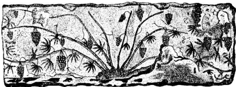
Изображение виноградной лозы на стене погребального склепа, Пантикапей I–II в. Формовка лозы в расстилку

Возможно, по этой причине варвары, познакомившиеся с греческими винами в ходе первых торговых контактов, стали отдавать привозному вину предпочтение и платили за него высокую цену: за амфору вина продавали в рабство человека.