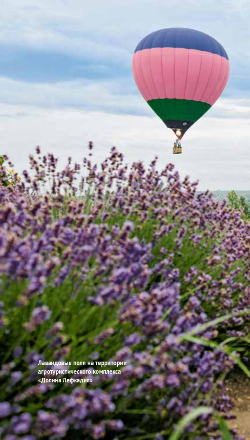
Лавандовые поля на территории агротуристического комплекса «Долина Лефкадия»