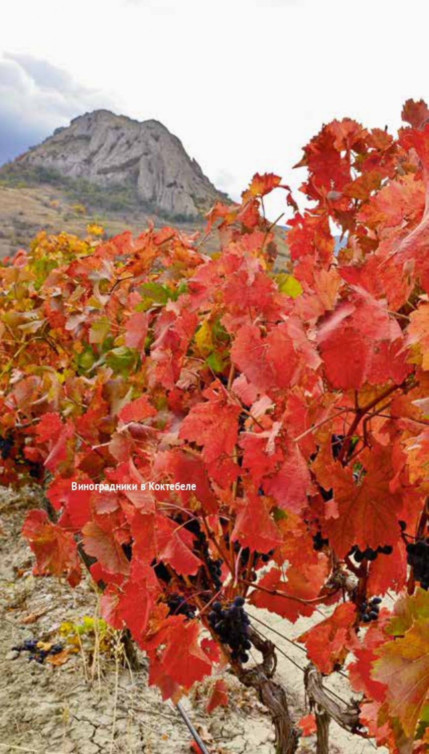
Виноградники в Коктебеле