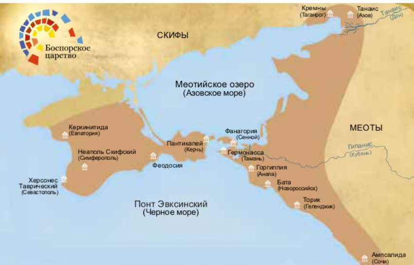
Территория Боспорского царства в I в. н. э.

С сер. I в. до сер. III в. отмечается новый последний расцвет Боспорского царства, но уже под контролем Римской империи. В начале этого периода в причерноморские степи продвинулись кочевники-аланы, но эта этническая перемена не привела к радикальному изменению военно-политической ситуации в Северном Причерноморье. Конец этого периода связан с вторжением в регион германских племен готы.