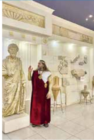
Археологический музей «Горгиппия»

Важно отметить, что степные засушливые пространства Боспорского государства не были освоены под виноградники. По крайней мере, пока там не найдено ни одной винодельни. Природные условия, большое количество микрогеографических зон, благоприятных для выращивания виноградной лозы, способствовали тяготению древнего виноделия к приморской зоне Боспора и глубинным районам его территории, где были достаточное количество влаги и благоприятный виноградарству изрезанный рельеф местности. Эти территории были заняты греческим или сильно эллинизированным варварским населением. Именно они активно занимались виноградарством и виноделием, сохраняя и поддерживая традиции боспорского виноделия.