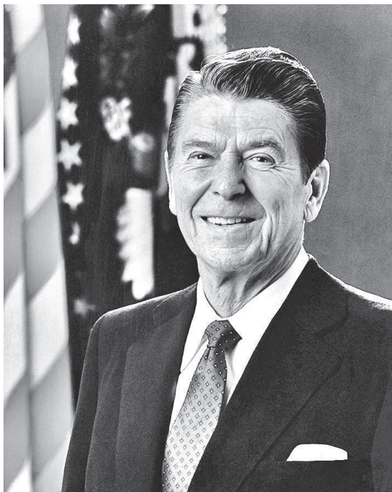
Рональд Рейган (1911 — 2004) — 40-й Президент Соединённых Штатов Америки (1981—89 гг.).

ларов, чтобы противостоять ей. Таким образом, мы должны относиться ко всем аспектам тайной войны... Самое последнее, на что мы можем пойти, — заковать в цепи нашу разведку. Ее функции защиты и информации необходимы в эру исключительной и постоянной опасности» 7 . В этом суждении много примечательного — как указание на стоимость разведки (не дешевле межконтинентальных ракет и термоядерных бомб), так и семантическая нагрузка сказанного.