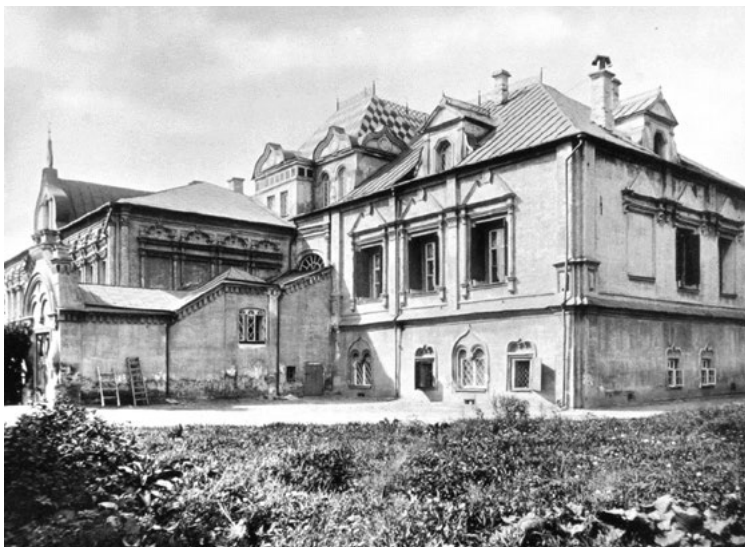
Дворец Юсуповых. XIX век

Дворец Юсуповых – старейшее на сегодняшний день московское здание, связанное с жизнью Пушкина. В основе дворца – палаты XVI–XVII века. Существующее ныне строение сформировалось в результате неоднократных реконструкций и перестроек из двух первоначально самостоятельных корпусов – восточного со столовой палатой и западного. К сожалению, о том, как они выглядели, остались