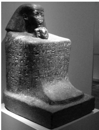
Статуя зодчего Сененмута с царевной Нефрура

дошел до Евфрата. В одной из надписей он называет себя Владыкой Вселенной.