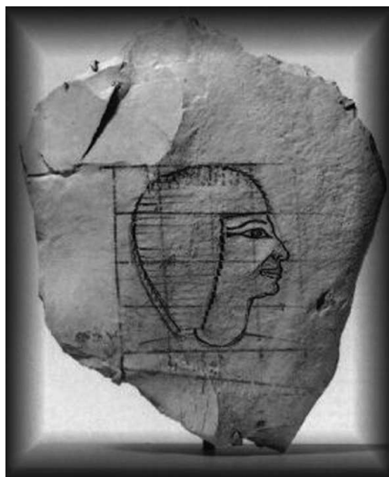
Голова Сененмута. Набросок

ки — соратники ее отца, мыслители (например, такие ее советники, как Тутти, Инэни и Сененмут), люди искусства. Очевидно, Хатшепсут умела убедить приближенных, что при новой власти им будет хорошо. Например, ее фаворит, архитектор Сененмут, имел двадцать должностей и титулов.