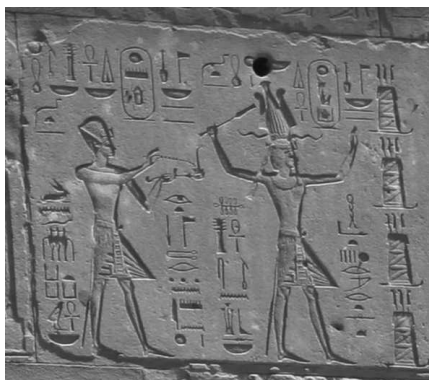
Рельеф из «Красного святилища» в Карнаке, изображающий Хатшепсут рядом с Тутмосом III

ление — она узурпатор, женщина, захватившая власть, не подпускавшая к трону законного фараона — своего пасынка.