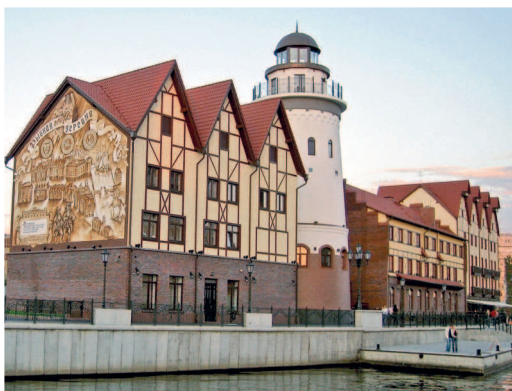
Набережная Рыбной деревни