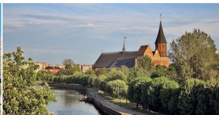
Вид на остров Кнайпхоф и собор