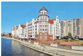
Вид на «Рыбную деревню»

Вечер. Проведите его по собственному усмотрению: сходите на вечерний спектакль в Драматический театр, послушайте органнй концерт в Кафедральном соборе или отправьтесь в один из модных ночных клубов, например в Nisha на проспекте Мира, 33.