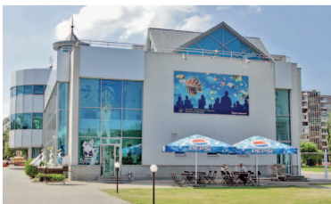
Музей Мирового океана

Ужин. Рекомендуем сходить в ресторан литовской кухни «Брикас» в торгово-развлекательном центре «Европа-Центр».