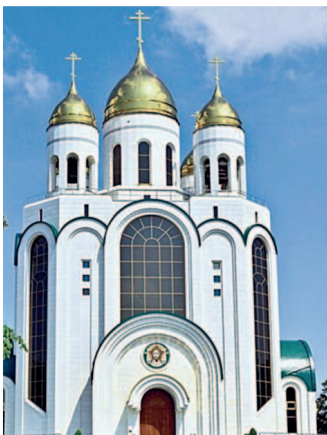
Храм Христа Спасителя