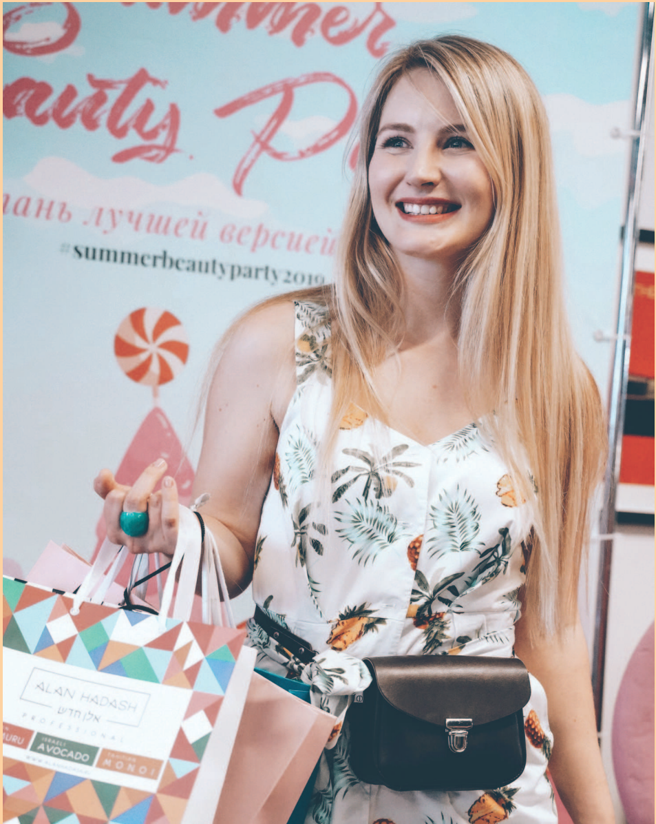
Вечеринка для блогеров в честь дня Рождения Royal Samples