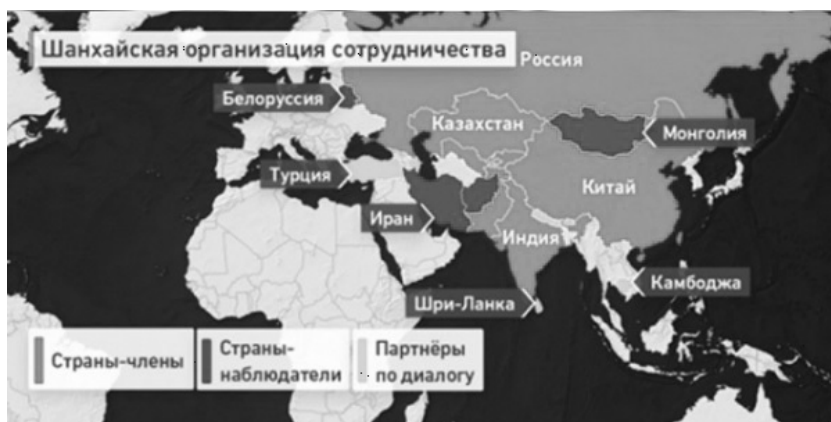
Рис. 3. Страны — члены ШОС.

рые сферы гипотетического взаимодействия, например экономика, поскольку экономические проекты во всех трех структурах (пусть и в разной степени) реализуются пока с большими сложностями.