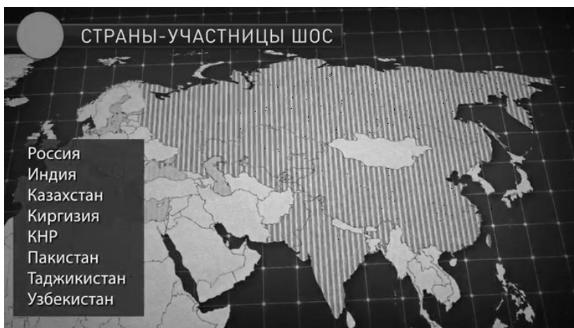
Рис. 1. Страны — участницы ШОС.

За более чем 15-летний период своего развития ШОС проделала значительную работу, став частью общемирового политического контекста, фактором серьезного международного звучания, с которыми вынуждены свыкнуться и считаться крупнейшие мировые акторы. То, что поначалу рассматривалось как ситуативное объединение, в короткие по историческим меркам сроки выросло в многопрофильную организацию, обладающую достаточной внутренней прочностью, эластичностью и внешней притягательностью, демонстрирующую открытость и готовность на прозрачной и равноправной основе вступать во взаимодействие со всеми, кто того реально желает 4 .