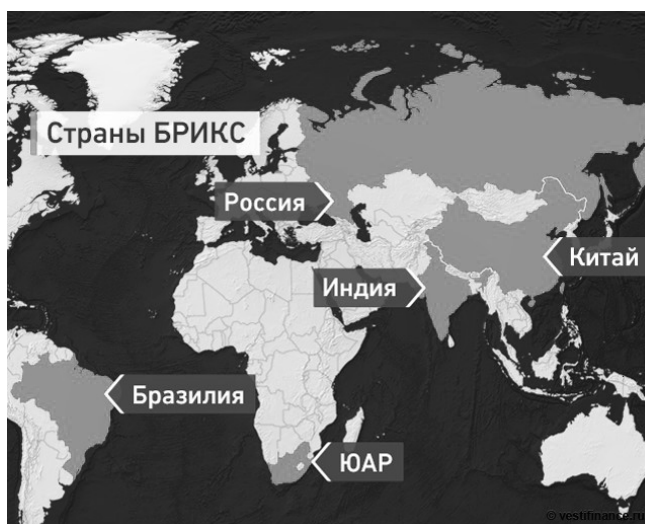
Рис. 1. Страны — члены БРИКС.

глав государств от 2002 г. (г. Санкт-Петербург), где говорилось, в частности, о задаче усилий по «построению нового демократического, справедливого и рационального политического и экономического международного порядка» 1 . Подобные положения можно найти в коммюнике проводящихся с 2005 г в специальном отдельном формате 12 встреч министров иностранных дел РИК, в декларациях вот уже девяти саммитов БРИКС и в другим документах 2 .