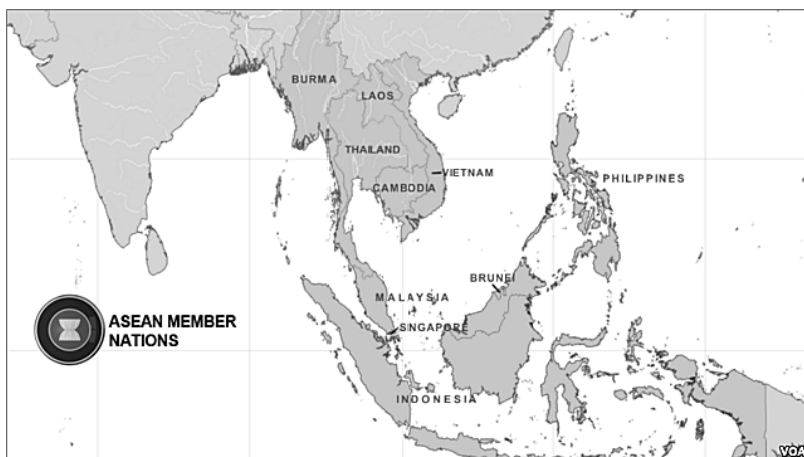
Рис 1. Государства — члены АСЕАН

Дело в том, что за прошедшие десятилетия АСЕАН приобрела уникальный опыт коллективной выработки общей линии поведения на международной арене, а также практики совместного нахождения решений имеющихся проблем на основе последовательного применения принципов консенсуса, невмешательства во внутренние дела друг друга, взаимопомощи, консультаций, доверия, терпимости и