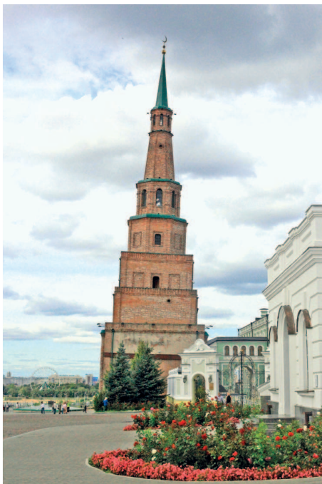
Падающая башня Сююмбике

Улица Баумана заполнена людьми в любое время суток