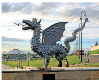
Крылатый змей Зилант — символ Казани