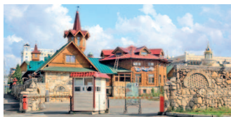
Татарская деревенька «Туган авылым» в центре города