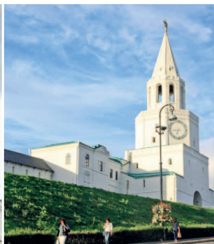
Спасская башня — главные ворота Кремля

Улица Баумана заполнена людьми в любое время суток