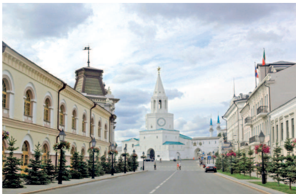
Вид на Спасскую башню со стороны Кремлевской улицы

День второй. Этот день рекомендуем начать с прогулки по Старо-Татарской слободе (▷ 40). Познакомьтесь со старинными домами и усадь-