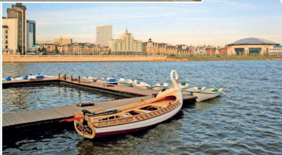
Прогулочные лодки ждут туристов на набережной озера Кабан