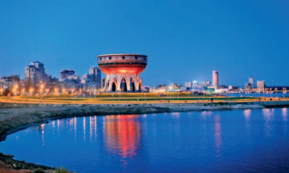
Панорама новых районов Казани