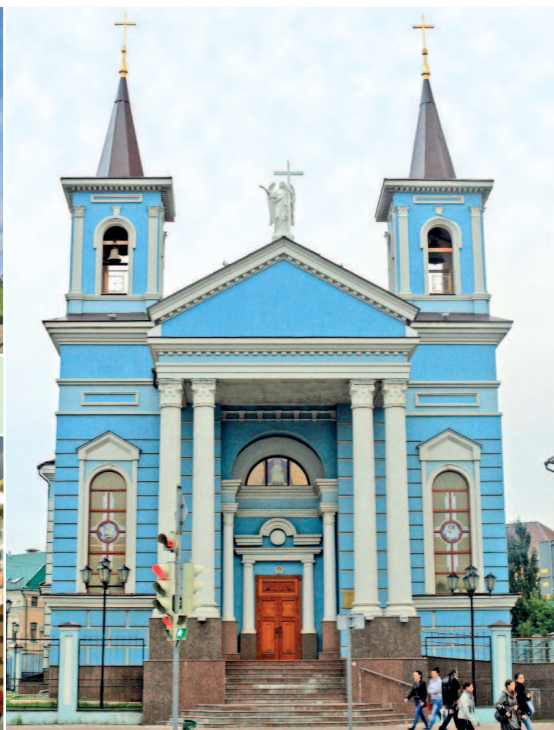
Католический храм Воздвижения Святого Креста