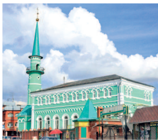
Одна из красивейших мечетей Казани — Султановская, основанная в 1868 году