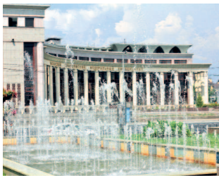
Площадь фонтанов перед театром Камала

Если вы держите в руках эту книгу, то, скорее всего, вы еще не бывали в третьей столице России. Но, вероятно, вы планируете визит в этот тысячелетний и одновременно такой молодой город. Мы, составители книги, постарались передать на ее страницах всю красоту и энергетику города, пропитанного историей, легендами, молодостью и событиями мирового масштаба.