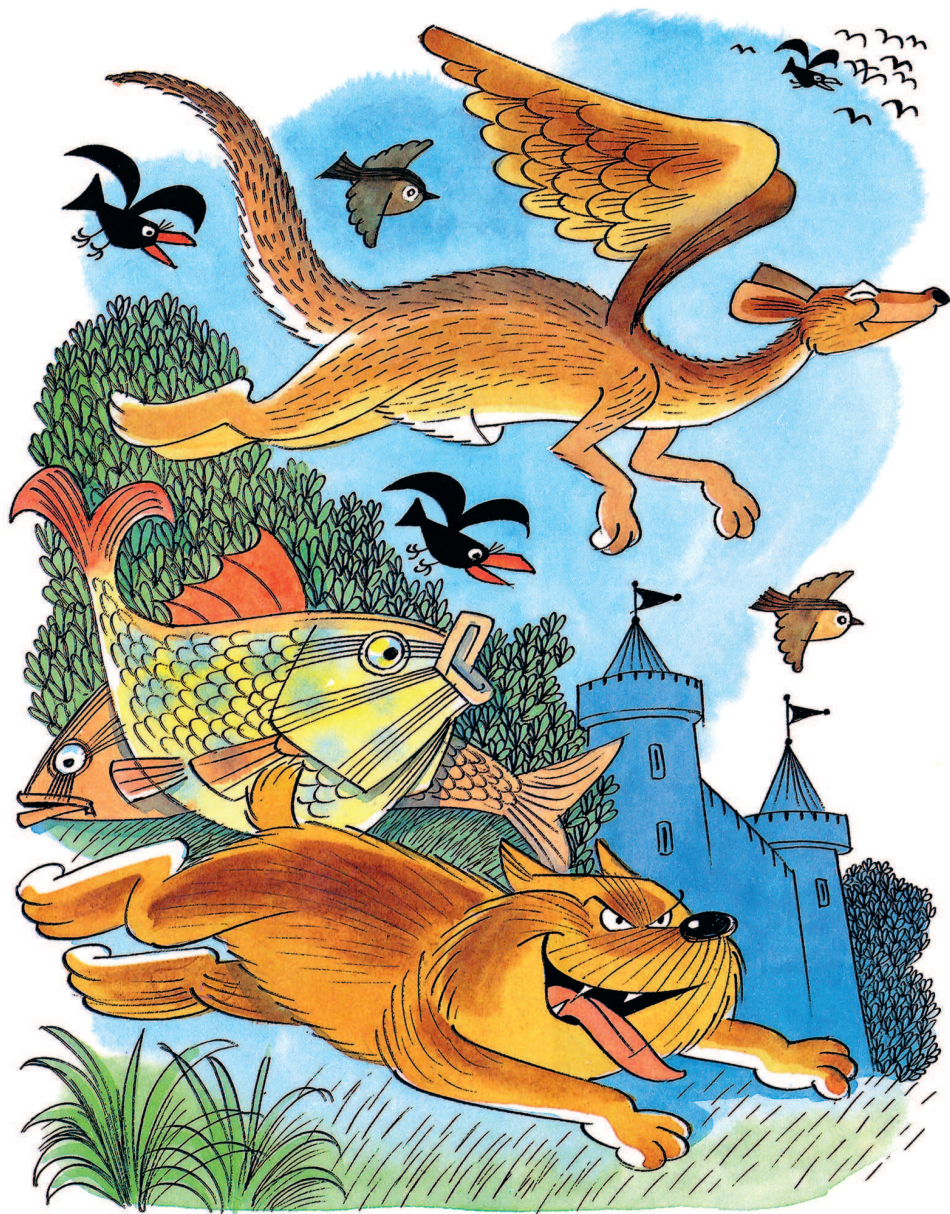
Рисунки В. Чижикова