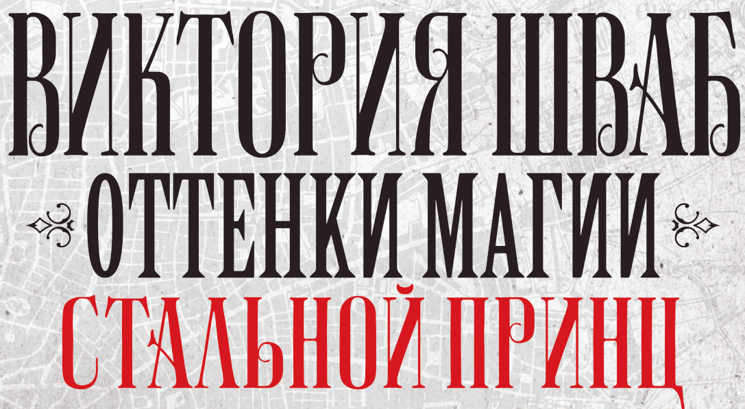
РИСУНОК АНДРЕА ОЛИМПИЕРИ