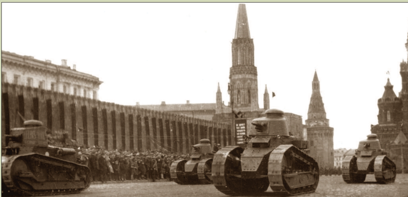
Легкие танки «Рено» FT17 и «Фиат-3000» «Феликс Дзержинский» (крайний слева) на Красной площади. 7 ноября 1928 г.