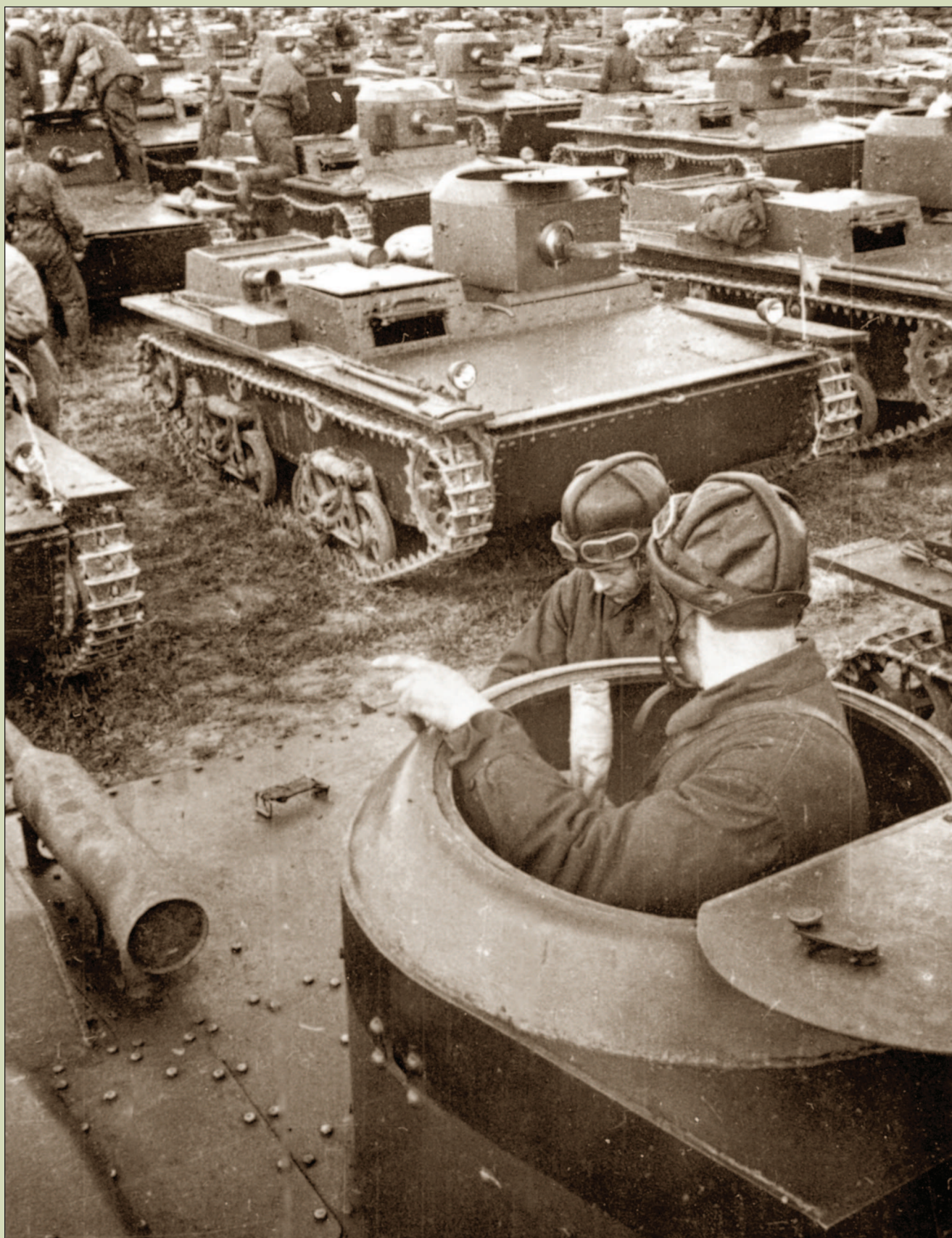
Малые плавающие танки Т-38 перед началом учений. Московский военный округ, лето 1937 г.