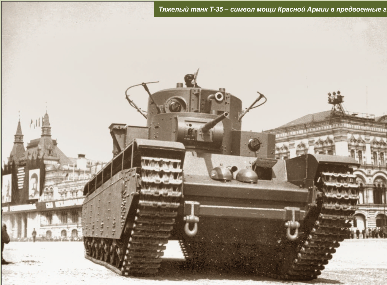
Тяжелый танк Т-35 – символ мощи Красной Армии в предвоенные г.

что советские моторизованные дивизии и танковые бригады 1940 года по числу боевых машин были равны немецкой танковой дивизии того же периода, но значительно уступали ей в артиллерии (особенно – противотанковой) и мотопехоте. Тем не менее, новая структура автобронетанковых войск и их боевой состав полностью соответствовали наличию бронетанковой техники, командных и технических кадров, а также сложившимся взглядам и накопленному опыту в области применения этого рода войск. К сожалению, эта структура просуществовала недолго.