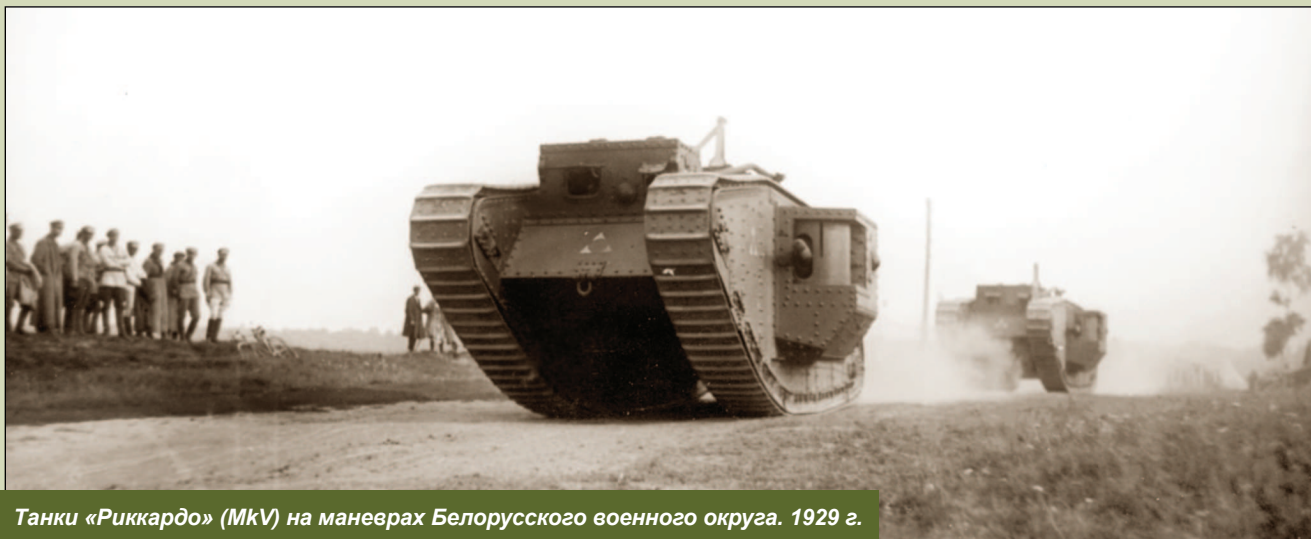
Танки «Риккардо» (MkV) на маневрах Белорусского военного округа. 1929 г.

ских кадров и овладение новой техникой личным составом армии. План этот начал претворяться в жизнь невиданными темпами.