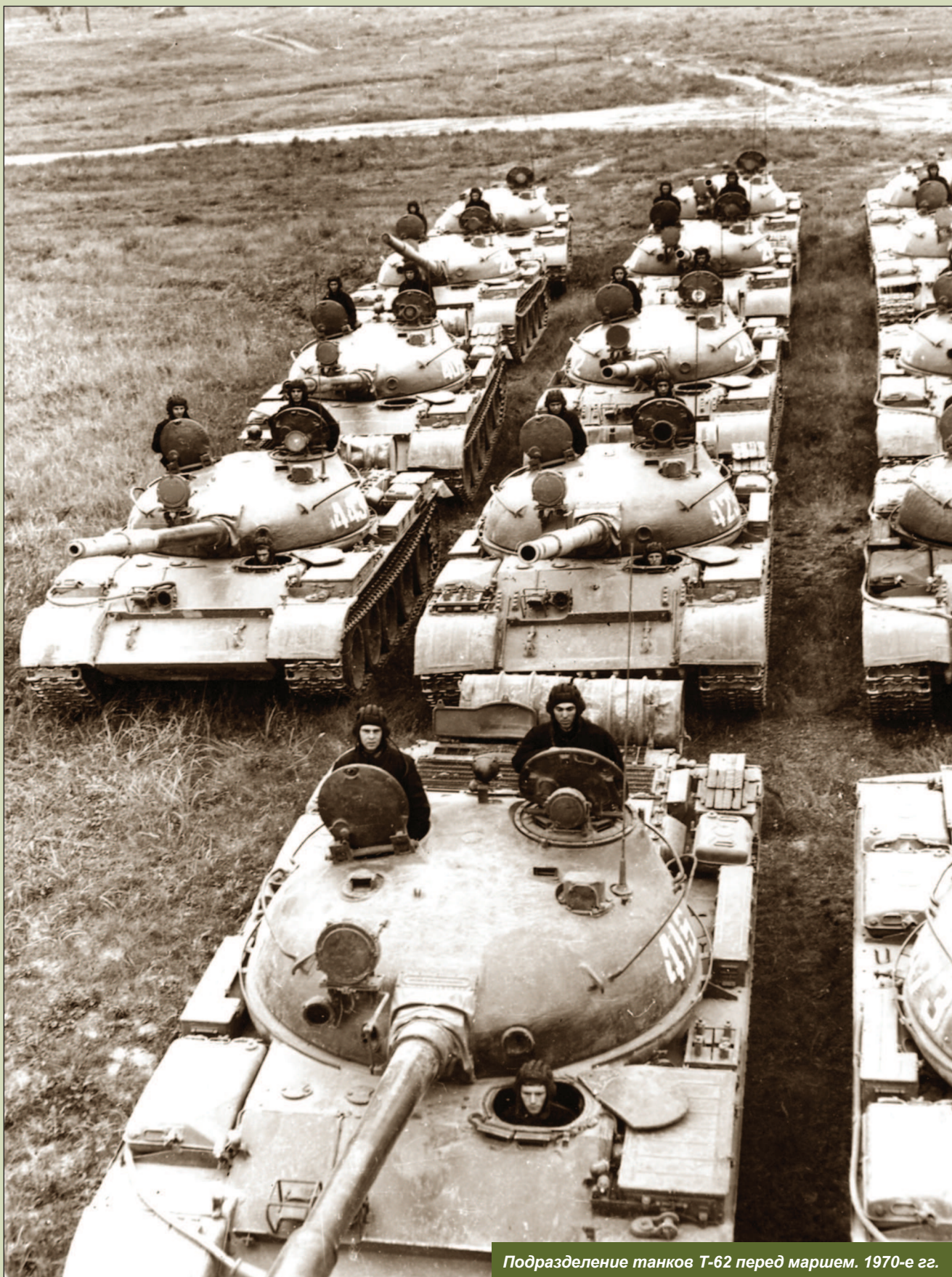
Подразделение танков Т-62 перед маршем. 1970-е гг.