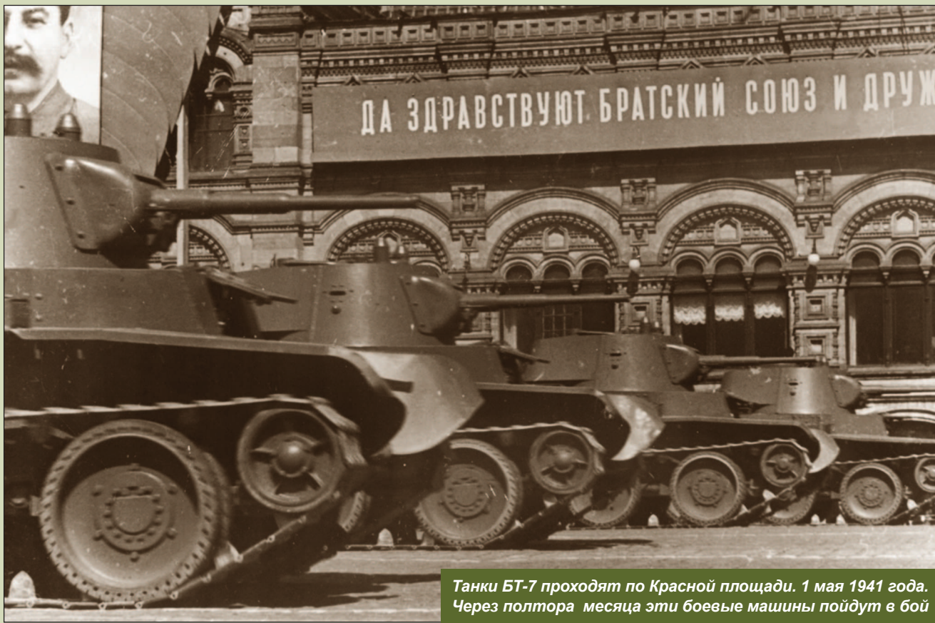
Танки БТ-7 проходят по Красной площади. 1 мая 1941 года. Через полтора месяца эти боевые машины пойдут в бой

12 февраля 1941 года, согласно постановлению СНК СССР «О мобилизационном плане на 1941 год», началось формирование еще 21 механизированного корпуса. По этому плану Красная Армия должна была иметь 61 танковую дивизию (в том числе три отдельные) и 31 моторизованную (в том числе две отдельные). Для обеспечения новых формирований требовалось уже около 32 тыс. танков, в том числе 16,6 тыс. танков Т-34 и КВ. Чтобы выпустить необходимое количество боевых машин при существовавшей в 1940 – 1941 годах мощности танковой промышленности, даже с учетом привлечения новых предприятий, таких, как Сталинградский и Челябинский тракторные заводы, требовалось не менее четырех – пяти лет. Трудно понять логику принятия такого решения, когда война буквально стояла у порога.