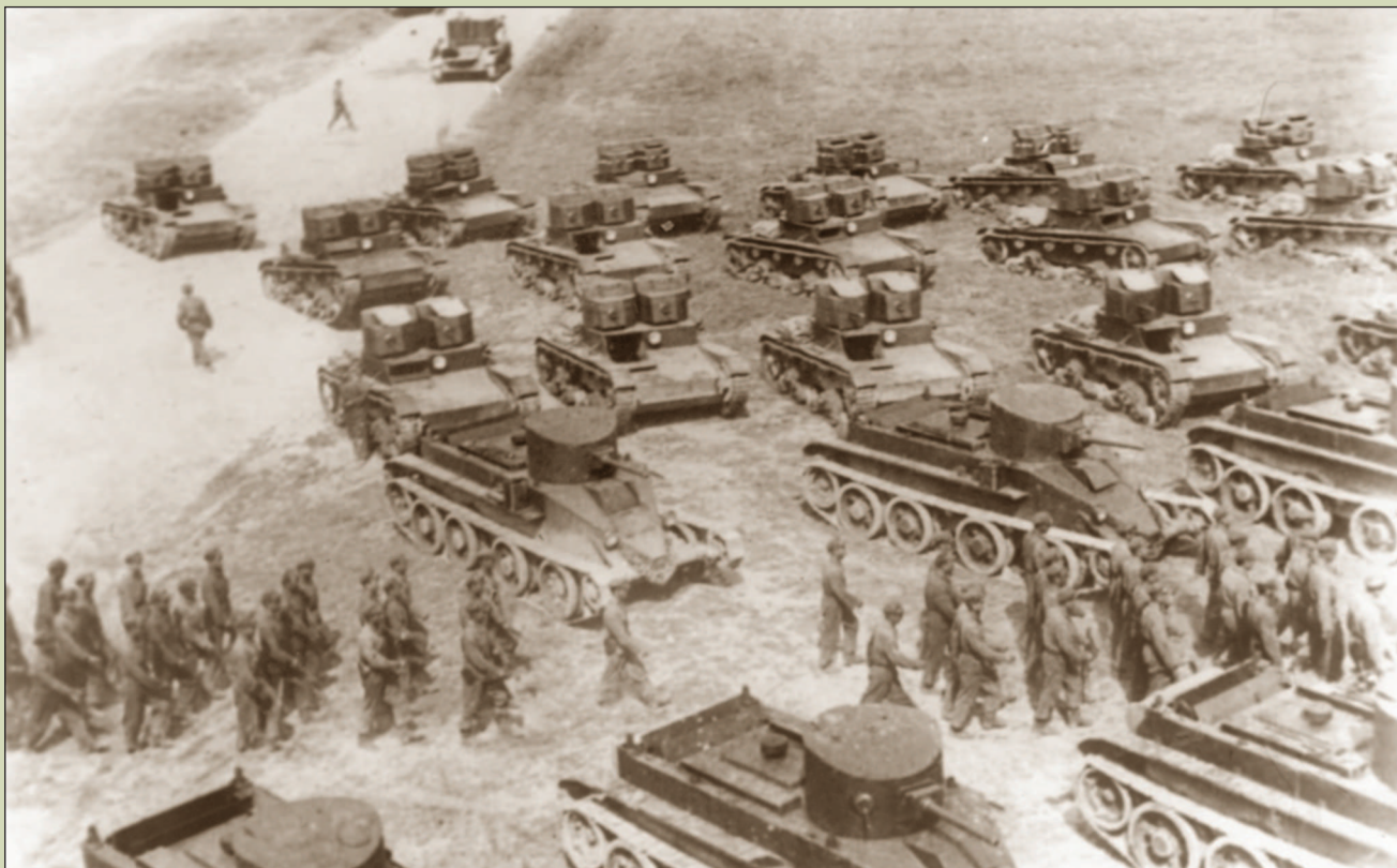
1-я механизированная бригада на тактических занятиях. Танки БТ-2 и двухбашенные Т-26. 1932 г.

К маю 1940 года реорганизация советских танковых войск в основном была завершена: в составе сухопутных войск Красной Армии теперь имелись четыре моторизованные дивизии и 39 отдельных танковых бригад (32 легкотанковых, вооруженных либо танками Т-26, либо БТ; три тяжелых, оснащенных танками Т-28, одна тяжелая с танками Т-28 и Т-35 и три химических). Это были полностью сформированные моторизованные и танковые соединения, обеспеченные материальной частью и подготовленными кадрами. Кроме указанных соединений имелись танковые полки, входившие в состав 20 кавалерийских дивизий, и танковые батальоны в 98 стрелковых дивизиях. Следует отметить,