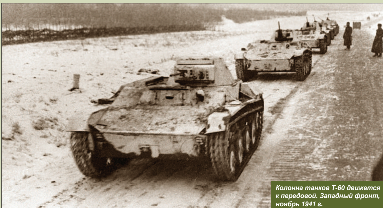
Колонна танков Т-60 движется к передовой. Западный фронт, ноябрь 1941 г.

При ведении встречного боя с вражескими танками рекомендовалось избегать лобовых атак, стремить-