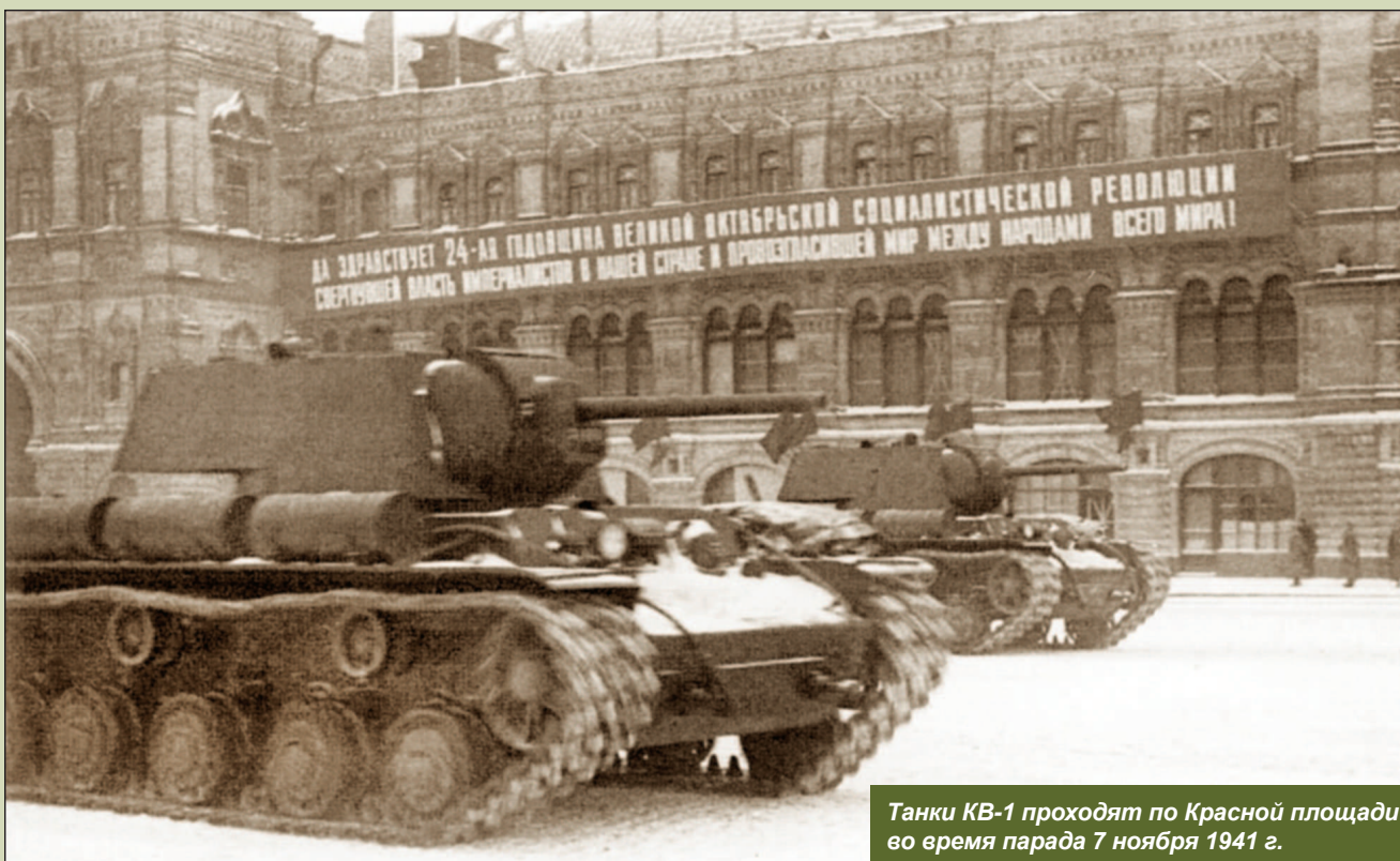
Танки КВ-1 проходят по Красной площади во время парада 7 ноября 1941 г.

В июле 1942 года в штат корпуса был включен отдельный гвардейский минометный дивизион, насчитывавший 250 человек и 8 реактивных установок БМ-13, разведывательный и мотоциклетный батальоны. Несколько позже в корпус поступили две подвижные ремонтные базы, а также рота подвоза ГСМ для обеспечения второй заправкой топлива и масла.