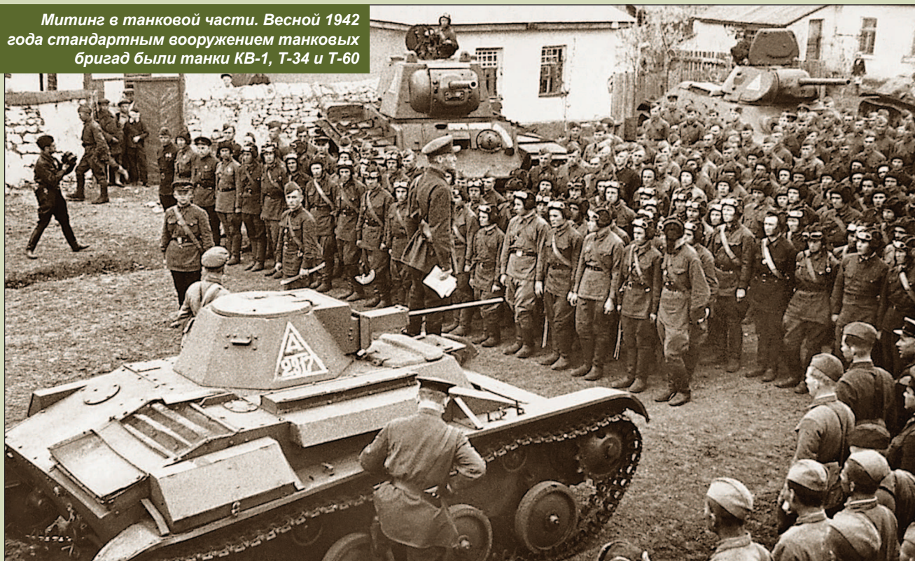
Митинг в танковой части. Весной 1942 года стандартным вооружением танковых бригад были танки KB-1, T-34 и T-60

В первой половине 1942 года танковые бригады, как отдельные, так и входившие в состав корпусов, формировались и укомплектовывались по различным штатам. Наличие в составе бригад батальонов