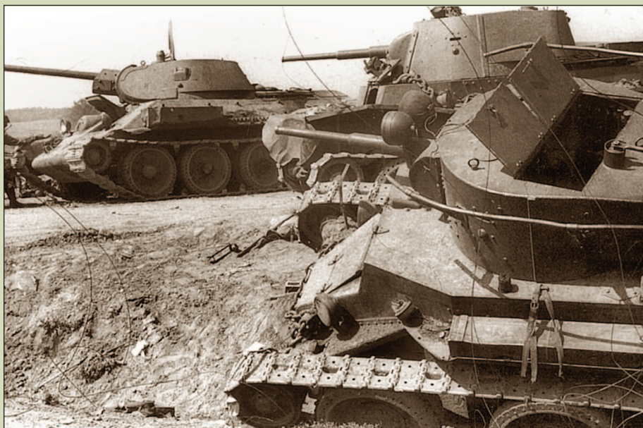
Оставленные экипажами танки Т-34 и БТ-7. Июнь 1941 г.

одна от другой на расстоянии 50 – 100 км и более. Подобная неудачная дислокация не позволяла в короткие сроки собрать основные силы корпусов для нанесения сосредоточенных ударов. Части и соединения вступали в бой разрозненно, часто выполняя противоречивые приказы. Все перечисленные обстоятельства привели к разгрому советских мехкорпусов, развернутых вдоль западной границы. С 22 июня по 9 июля 1941 года потери Красной Армии составили 11 712 танков (среднесуточные – 233 танка). Очевидная неспособность командного состава руководить действиями крупных танковых соединений, привели к экстренному переходу от корпусов к более мелким частям – бригадам и батальонам. Что же касается огромных потерь боевой техники, то следует отметить, что даже в тяжелейшей для Советского Союза второй половине 1941 года отечественная промышленность выпустила 4742 танка (Германия за весь 1941 год – 3725 танков и штурмовых орудий). На 1 января 1942 года на советско-германском фронте соотношение танков составляло 1588:840 (1,9:1) в нашу пользу. Никогда за все время Великой Отечественной войны немцы не имели превосходства над Красной Армией в танках в целом.