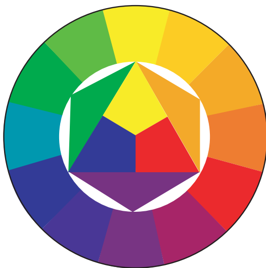
Хроматический круг Иоганнеса Иттена

Хроматический круг, разработанный художником Иоганнесом Иттенем, позволяет лучше ориентироваться в мире цвета. Иттен расположил три первичных цвета в центре круга.