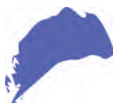
индиго (синий + фио- летовый)