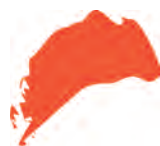
алый (красный + оранжевый)