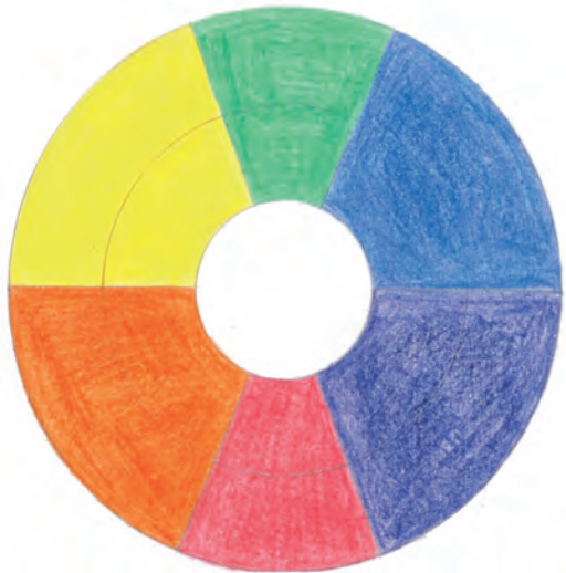
Психологическая сила цвета

В начале XIX века Иоганн Вольфганг фон Гёте изложил новую теорию: цвет происходит из слияния света и темноты, объединение которых дает серый цвет. Серый цвет, таким образом, рассматривается как основа всех других цветов.