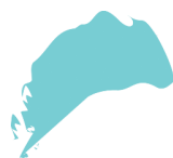
бирюзовый (синий + зеле- ный)