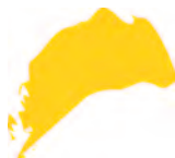
золотистый (желтый + оранжевый)