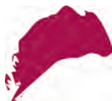
пурпурный (красный + фиолетовый)

Существует еще шесть третичных цветов, которые являются смесью одного первичного и одного вторичного цветов.