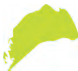
салатовый (желтый + зе- леный)