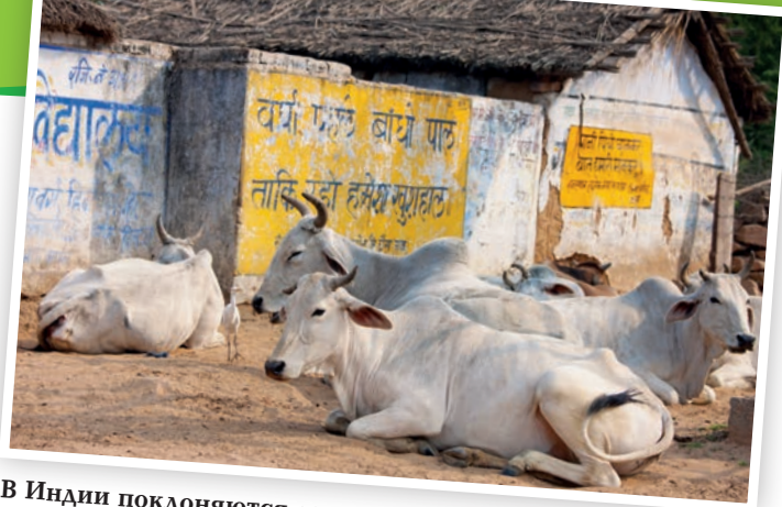
В Индии поклоняются семи коровам «высшего небесного пространства».

Висячие сады Семирамиды и Александрийский маяк должны были свидетельствовать о высочайшем