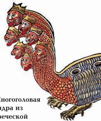
Многоголовая гидра из греческой мифологии изображена здесь с семью головами.