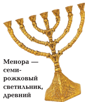
Менора — семи-рождковый светильник, древний символ иудаизма.