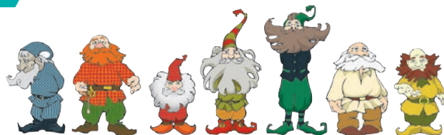
Сказочная семёрка: семь гномов