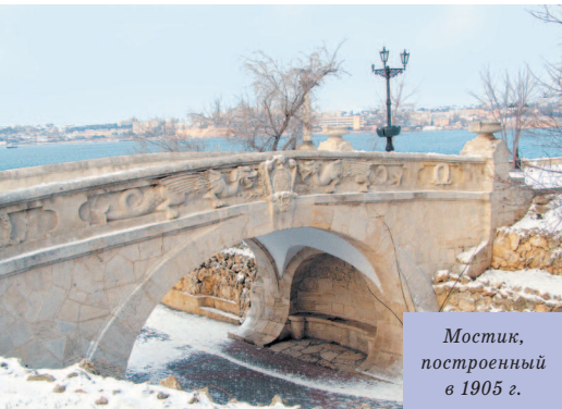
Мостик, построенный в 1905 г.

вая пристань в Севастополе была построена почти сразу после основания города (1783 г.) по указанию командующего Черноморской эскадрой графа Войновича. И, хотя официально она называлась Екатерининской, народ упорно именовал ее Графской. Граф, видимо, был личностью неприязнательной, и обычный деревянный причал, без всяких архитектурных изысков, его устраивал. Знаменитая колоннада появилась только в 1846 г. В те годы военным губернатором Севастополя был адмирал Лазарев. Он и решил облагородить неказистую пристань. Проект был заказан военному инженеру Д. Уptonу. В те времена любой архитектурный проект должен был представляться для утверждения на высочайшее имя. Сложно сказать, чем Николаю I не понравилась колоннада. Проект был утвержден без нее. Каких только аргументов не приводил военный губернатор, чтобы убедить монарха в целесообразности постройки.