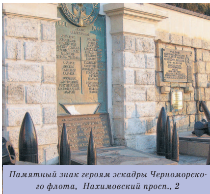
Памятный знак героям эскадры Черноморского флота, Нахимовский просп., 2

За памятником просматривается ажурная колоннада 6 Графской пристани. Пер-