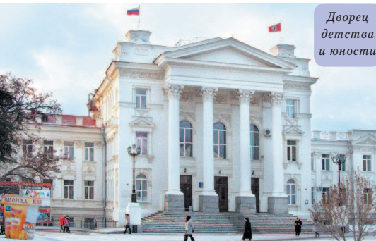
Дворец детства и юности

На противоположной, Северной, стороне видны две монументальные массивные постройки – Михайловский (прямоугольный) и Константиновский (полукруглый) форты – береговые укрепления, возведенные накануне Крымской войны в 1846 и 1847 гг. Изначально фортов было 5 на разных мысах вокруг Севастопольской бухты. Один из них – Николаевский – находился как раз на месте Приморского бульвара. До наших дней сохранились только два. Их мощные стены выдержали артобстрелы Крымской и Великой Отечественной войн. Сейчас Константиновский находится на территории военной части, а Михайловский является музеем и открыт для посещения.