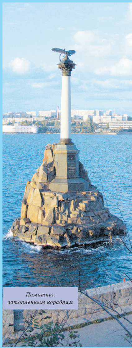
Памятник затопленным кораблям

С самого начала город делился на три части: Центральную часть, Корабельную сторону и Северную сторону. На Корабельной и Северной селился простой люд, оставшие матросы с семьями, а центральная считалась аристократической. Но и здесь, сразу за домами почтенных граждан, начиналась безобразная