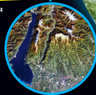
Из космоса видны горы и реки на поверхности нашей планеты.

передвигаются. Они медленно плавают по расплавленной магме в глубине Земли. В некоторых местах на планете рождаются горы, а где-то образуются провалы и пересыхают реки.