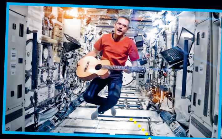
Кристофер Хэдфилд плывёт в невесомости по космической станции. Он играет на гитаре.

Наша родная планета живая и постоянно меняется. Вода в горах и на равнинах создаёт глубокие речные долины, на первый взгляд неподвижные континенты тоже незаметно