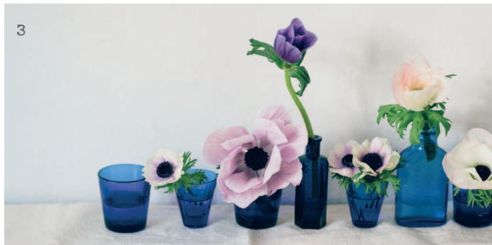
Мимоза (1), мускари (2), анемоны (3), анютины глазки (4), ландыш (5)