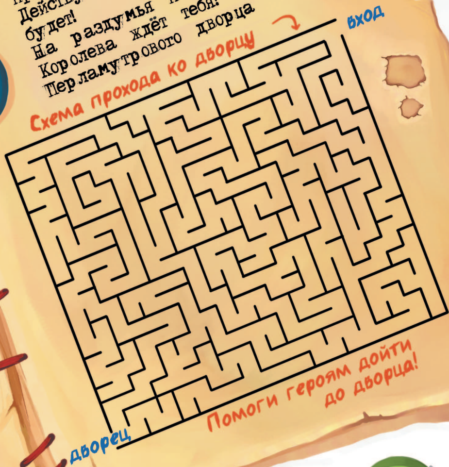
Схема прохода ко дворцу

На раздумья нет времени! Королева ждёт тебя! На балконе Перламу трового дворца