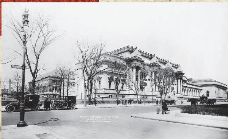
Вид на фасад Метрополитен-музея на перекрестке 5-й авеню и 81-й улицы, Нью-Йорк. 1914.