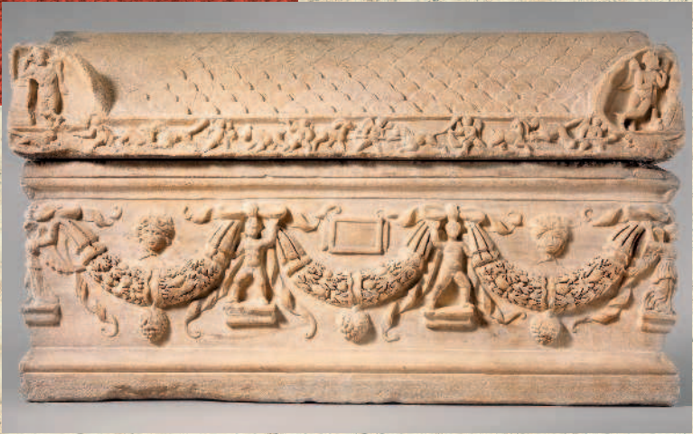
Мраморный саркофаг с гирляндами. 130–150 гг. н.э.

ной миссией — просвещать рядовых американских трудящихся — на первых порах возникли сложности. Часы работы музея совпадали с рабочим днем, поэтому первыми посетителями там были все те же богатые бизнесмены, что его основали. Неспроста главные герои романа Эдит Уортон «Эпоха невинности» преуспевающий юрист Ньюланд Арчер и графиня Эллен Оленская выясняют отношения и признаются друг другу в любви именно во время посещения Метрополитен-музея. Ведь здесь никто, кроме безучастного сторожа, не в состоянии им помешать.