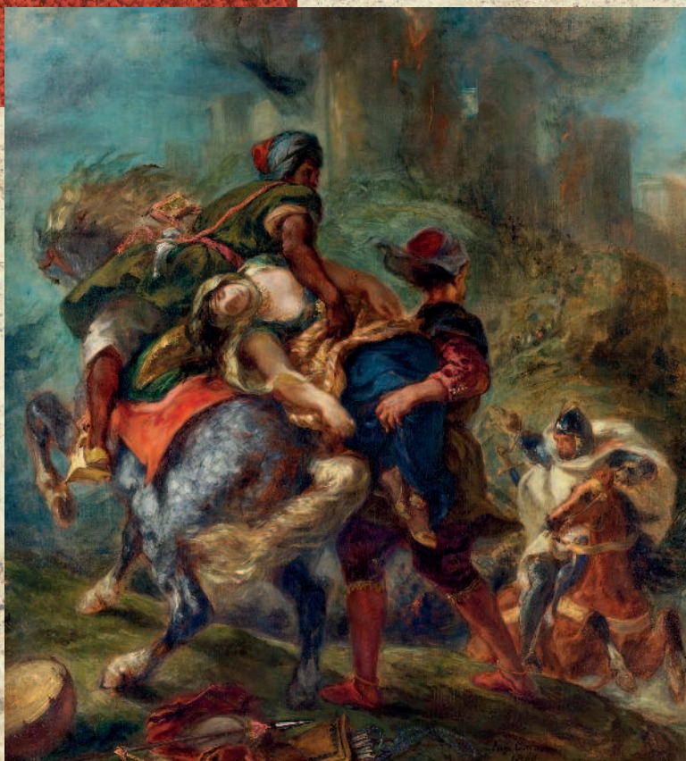
Эжен Делакруа. Похищение Ревекки. 1846. Коллекция Кэтрин Лориллард Вулф. Фонд Вульфа

нию Кэтрин Вульф, музей получил 143 картины художников ее времени и денежную сумму, на которую были куплены картины «Мадам Шарпантье с детьми» Огюста Ренуара, «Бой быков» Франсиско Гойи и «Похищение Ревекки» Эжена Делакруа. В 1889 году Эрвин Дэвис подарил музею картину «Женщина с попугаем» Эдуарда Мане.