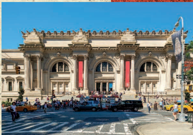
Вид на современный фасад Метрополитен-музея в Нью-Йорке

Настоящий бум создания публичных музеев пришелся на время после окончания Гражданской войны в 1861–1865 годов и реконструкции Юга, когда американская экономика перешла в фазу активного роста: самыми быстрыми темпами в истории страны увеличивались заработная плата, на-