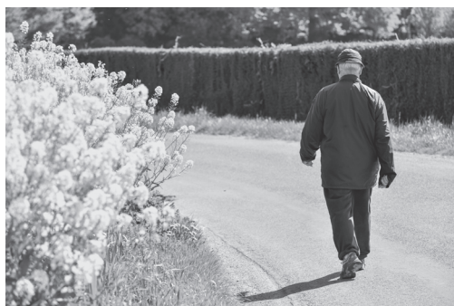
Рис. 7.2. Повседневная ходьба