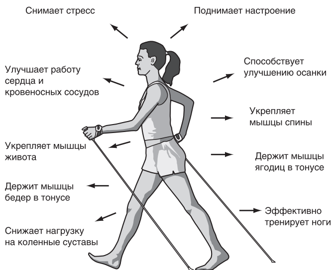
Рис. 7.5. Скандинавская (нордическая) ходьба

бегом, что особенно важно для лиц с отклонениями в состоянии здоровья (Линдберг А., Мак-Комас А.Дж.).