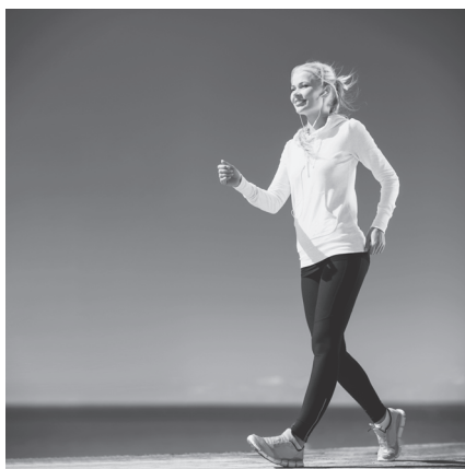
Рис. 7.4. Спортивная ходьба