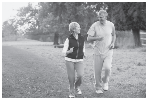
Рис. 7.3. Оздоровительная ходьба

Скандинавская (нордическая) ходьба по сравнению с оздоровительной является более сложнокоординационным видом двигательной активности. Благодаря использованию специальных палок, обеспечивающих вовлечение в движение большого количества мышц, повышается эффективность и безопасность тренировок для пациентов (рис. 7.5). В процессе занятий скандинавской ходьбой увеличивается способность тканей извлекать кислород из крови за счет повышения концентрации миоглобина и мощности митохондриальной системы в скелетной мускулатуре. Это позволяет повысить эффективность тренировок при относительно низком уровне (интенсивности) нагрузки и скорости ходьбы.