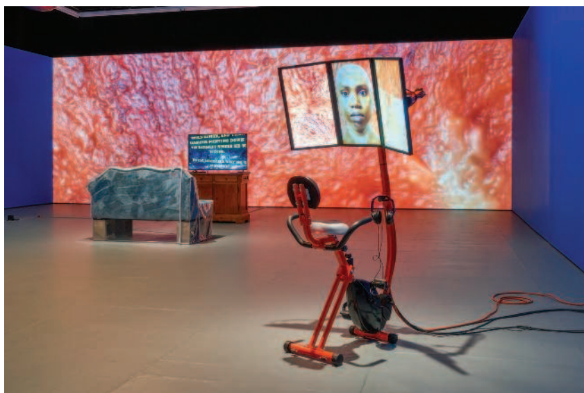
Сверху: Сондра Перри. Обитель зла. 2016

Микроскопические проекции клеток кожи художницы, пульсирующие как лава или пламя, образуют фон для ее выставки. Мониторы LCD, установленные на рабочих станциях-велосипедах, заставляют посетителей работать во время просмотра, противопоставляя настойчивость индустрии wellness на продуктивности и саморазвитии и уязвимость появляющихся жизнью чернокожих. Видеоролики, в число которых входят случайные съемки, в том числе, снятые на смартфоны свидетелями жестокости полиции, подчеркивают, как социальные сети преследуют образы черной смерти. Трехмерное изображение, основанное на чертах Перри, предполагает более высокую (ИЛИ СТОЙКУЮ) чувствительность к оцифровке, выполняемой искусственным интеллектом, которая превосходит существующие форматы: «Мы — вторая версия себя, о которой мы знаем, — говорит 3D-изображение на распев, — полностью отображаемая», но с ограничениями, поскольку «не возможно воспроизвести всю полноту в программном обеспечении, которое использовалось для нашего создания».