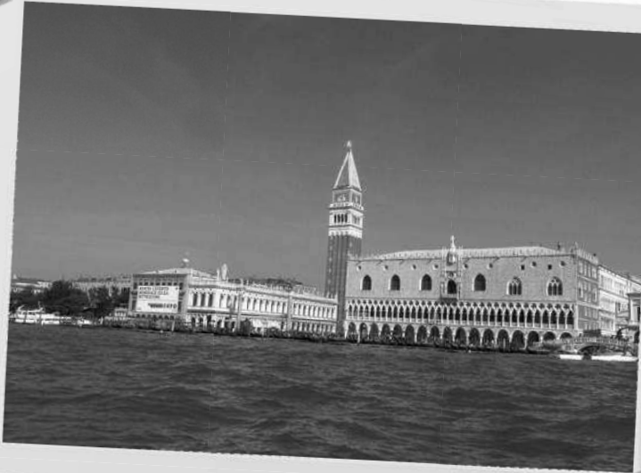
Подливая к Сан-Марко

хов крыльев — и улыбаюсь во весь рот, собрав вокруг толпу народа, веселящуюся при виде моей «сбычи мечт».