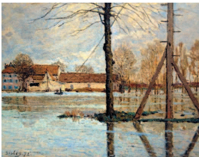
АЛЬФРЕД СИСЛЕЙ. Иль-де-ла-Лож. Паводок. 1872. Копенгаген, Новая глиптотека Карлсберга.