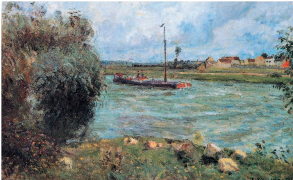
КАМИЛЬ ПИССАРРО. Берега Уазы в Понтуазе. 1877. Частное собрание.