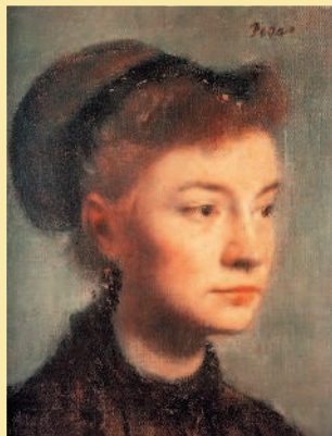
ЭДГАР ДЕГА. Портрет молодой женщины. 1867. Музей Орсе, Париж.

«Я был и хочу оставаться импрессионистом. Я сам изобрел это слово или по крайней мере выставил картину, которая дала повод какому-то репортеру пустить в ход эту кличку. Как видите, она имела успех...»