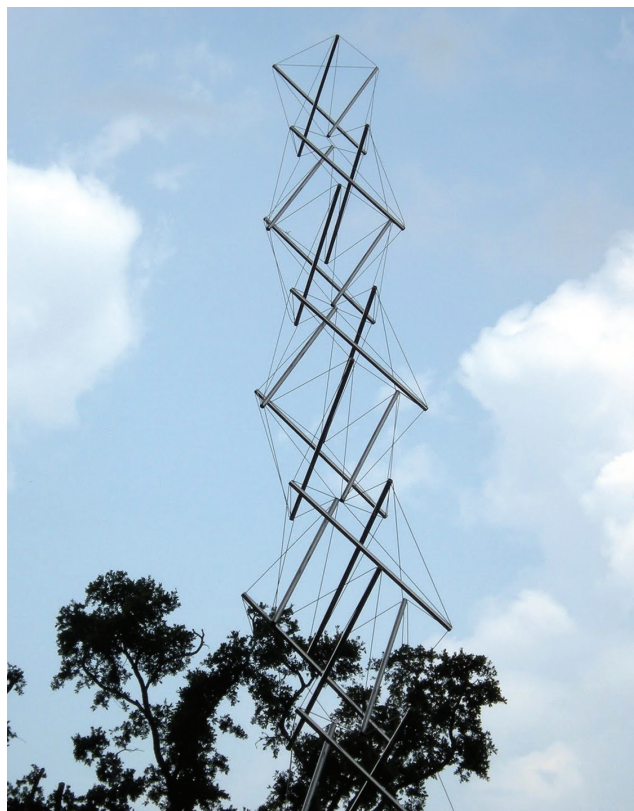
Рис. 0.4. Используя натянутые тросы и металлические распорки, можно создать самонесущие конструкции. Целостность этой конструкции определяется взаимодействием элементов сжатия и натяжения. Как отмечает Снельсон, если в простой структуре разрушение одного элемента может привести к разрушению всей структуры, в более сложных конструкциях подобный вызов в одной из ее областей приведет к менее катастрофическим последствиям (подробнее об этом — на его веб-сайте http://kennethnelson.net/faq ). Мы снова вернемся к этому, когда будем рассматривать тело и то, как оно может адаптироваться к дисфункции в какой-либо из его областей

Вплоть до XX века ученые придерживались преимущественно картезианского подхода к восприятию тела, концентрируясь на его частях и поддерживая образ тела, работающего по принципу архитектурной машины. Подобный взгляд не оспаривался вплоть до 1948 года, когда скульптор Кеннет Снельсон создал серию структур, неумышленно имитировавших взаимодействие между костями и миофасцией тела (см. рис. 0.4). Снельсон, обучавшийся у философа и архитектора Бакминстера Фуллера, использовал натянутые провода для обеспечения поддержки прочным компрессионным распоркам. Фуллер продолжил развивать эти идеи и геометрию того, что он впоследствии назвал структурами тенсегрити, используя их в качестве моделей для элементов естественного мира, начиная от атома до человечества и Вселенной в целом (интересный отголосок стремлений более ранних натурфилософов