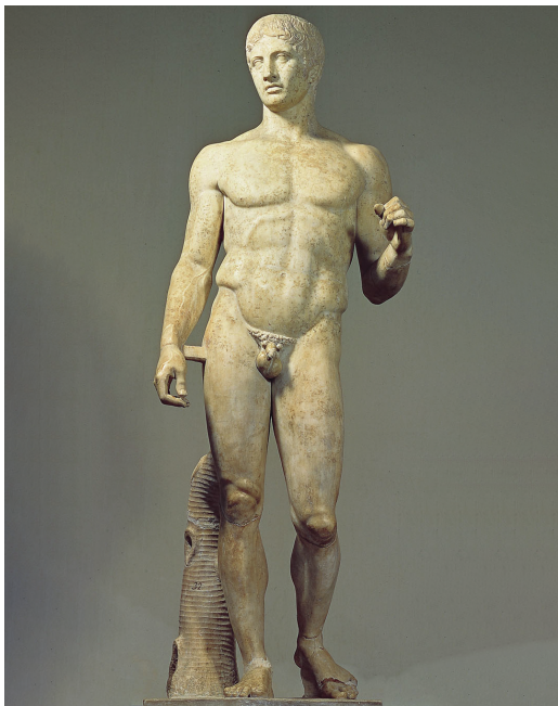
Рис. 0.2. Статуя копыеносца была первоначально создана Поликлетом в 450–400 гг. до н. э. Она являлась примером идеальных пропорций человека, на который ссылались многие, в том числе Гален, чрезвычайно влиятельный врач, живший 600 лет спустя, а также Витрувий и, наконец, да Винчи

Рисуя Витрувианского человека, да Винчи хотел продемонстрировать свое совершенное владение анатомией и понимание божественного начала, а также свою искусность в механике и архитектуре. Поместив человеческую форму внутри круга и квадрата, он тем самым демонстрировал соотношение божественного и земного в теле, а небольшое смещение круга вверх позволило пупку стать как геометрическим, так и физиологическим центром (см. также рис. 0.2). Однако он использовал инструменты того времени: угольник и компас. Тем самым Леонардо заложил первый камень недопонимания анатомии в современном мире, определив геометрическое совершенство анатомии, основанное на инструментах и методах строительства XV века.