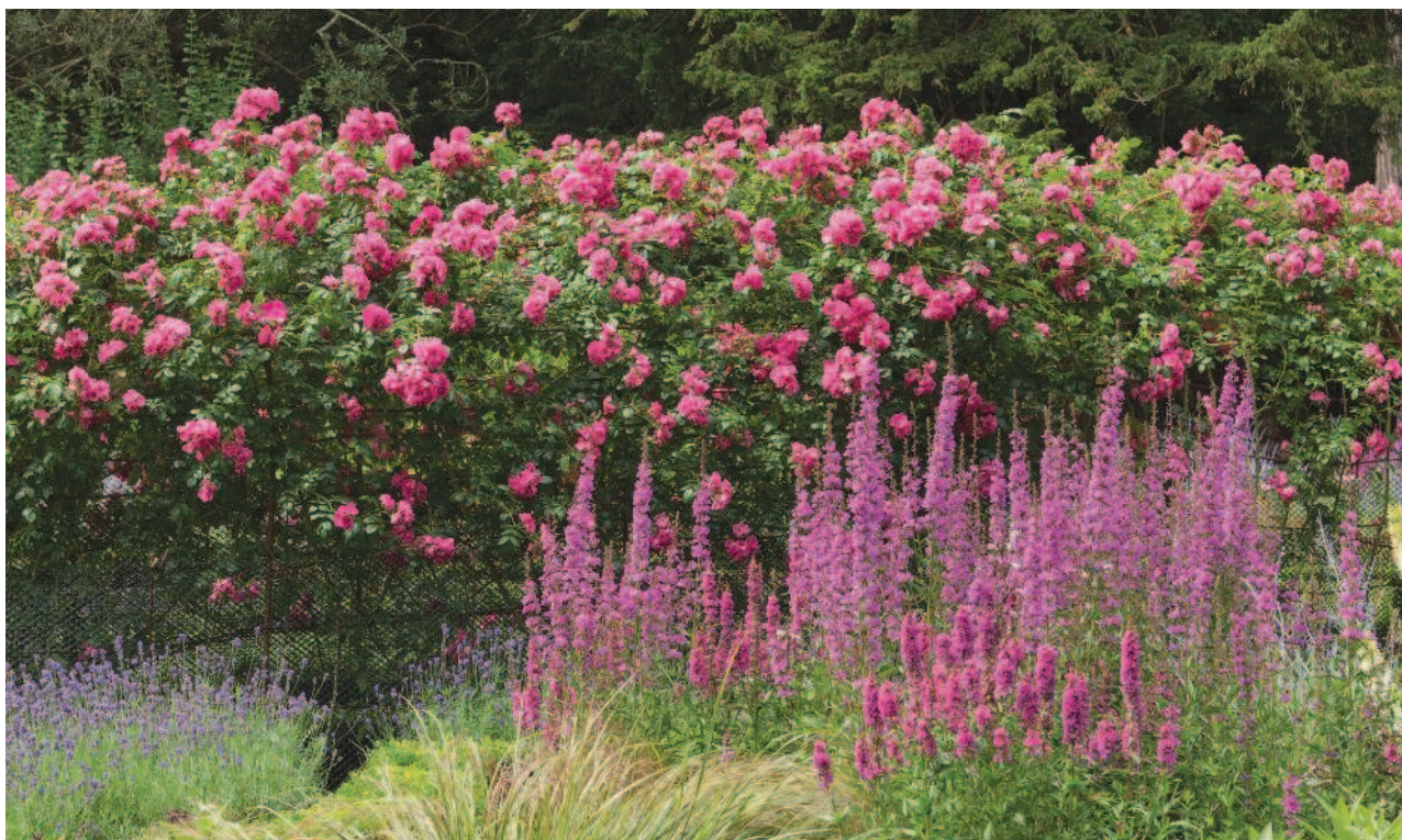
▲ Ограда из парковых роз