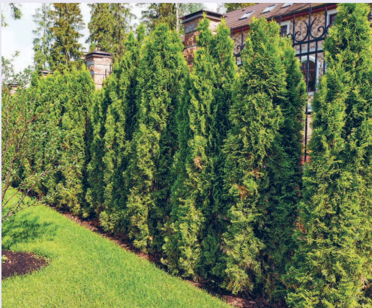
▲ Забор из туи с пирамидальной формой