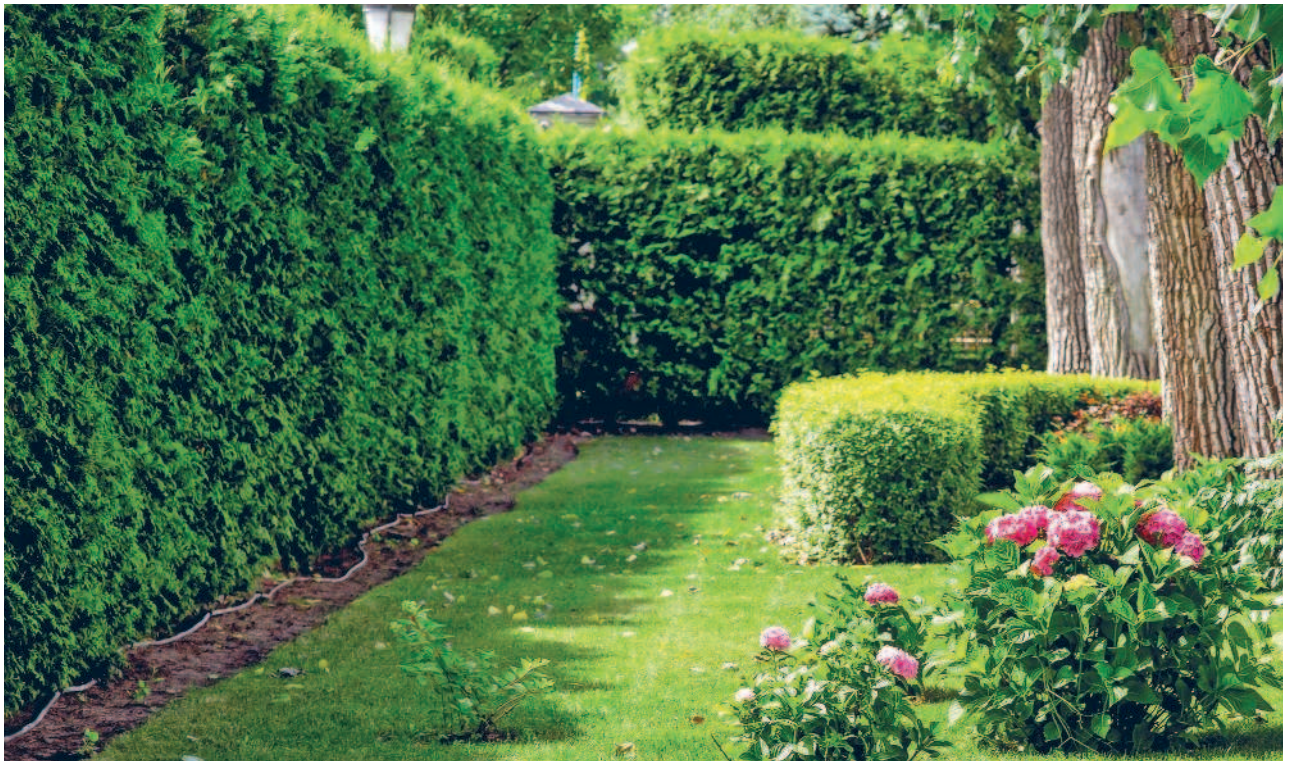
▲ Забор из стриженной туи