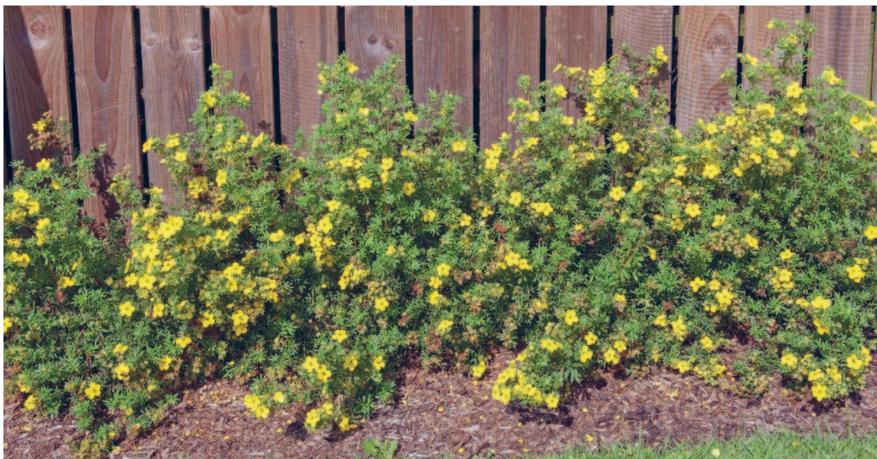
▲ Ограда из курильского чая