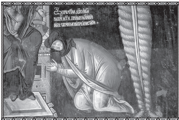
Моление преподобной Анастасии. Фреска в монастыре Студеница

Рядом с местом ее первоначального захоронения на стене храма можно увидеть фресковое изображение монахини Анастасии, припадающей к престолу Пресвятой Богородицы со словами молитвы: «О, Пресвятая Дева и Бога Нашего Мати, прими моление рабы Своей, монахини Анастасии».