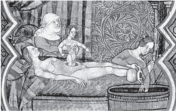
Рис. 1. Рождение Юлия Цезаря путем кесарева сечения (миф). Гравюра неизвестного автора. Иллюстрация из книги: «Les anciennes hystoires rommaines: a compilation of ancient history, the origin of which is investigated by M. Paul Meyer in Romania». Paris. — 1400. — Vol. XIV. P. 1–81. Британская библиотека, шифр: Royal MS 16 G VII.