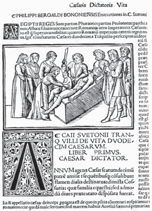
Рис. 2. Рождение Юлия Цезаря путем кесарева сечения. Иллюстрация с гравюры на дереве (ксилография) из издания Filippion Beroaldo's (1453–1505) «De vita Caesarum». Venise, 1506. Одна из самых ранних печатных иллюстраций кесарева сечения. (Цит. по: Histoire des sciences médicales. 1996. Vol. XXX. N. 2. P. 259–268.)