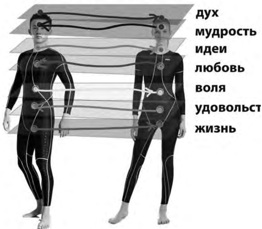
Рисунок 1. Духовная пара