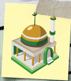
Университет Равен Брукс