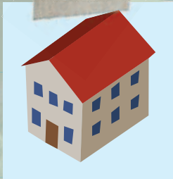
Начальная школа Равен Брукс