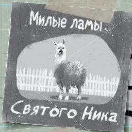
Лاما-ферма Святого Ника