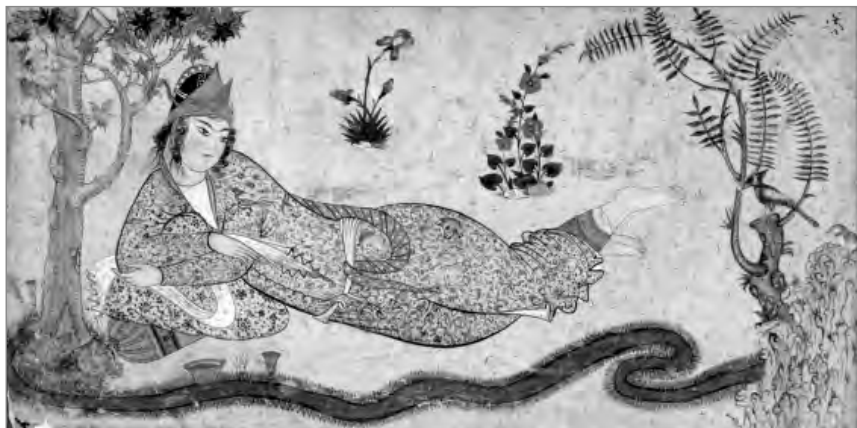
Царица Билкис. Персидская миниатюра, 1590 г.