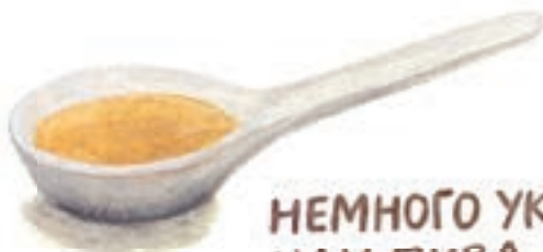
НЕМНОГО УКСУСА ИЛИ ПИВА