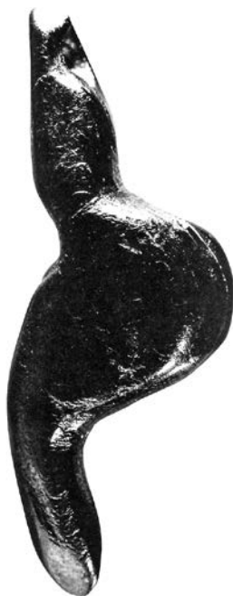
Рис. 4. Венера из Петерфельда (амулет из черного янтаря, последняя часть мадленского периода палеолита, Германия, примерно 15 000 лет до н. э.)

Эти трехмерные фигуры — первые идолы , как их называют в истории искусства. А изображали они ту, которая была обычной музой, воплощавшей силу женского тела, преображающего и дающего жизнь. Такие фигурки находят не в пещерах, где мужчины исполняли свои охотничьи ритуалы, а там, где люди жили, в укромных убежищах возле скал. Одна из отличительных особенностей найденных статуэток — отсутствие лица с опре-