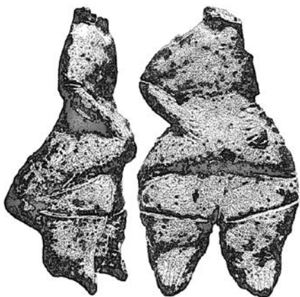
Рис. 5. Беременная Богиня (резьба по камню, эпоха неолита, Греция, около 5800 г. до н. э.)

деленными чертами. Такая подчеркнутая таинственность объясняется тем, что они изображают не конкретную личность, а просто Женщину как явление природы. Обычно у этих фигурок нет ног, что наводит на мысль, будто их специально так делали, чтобы вкапывать в вертикальном положении в землю в маленьких святилищах.