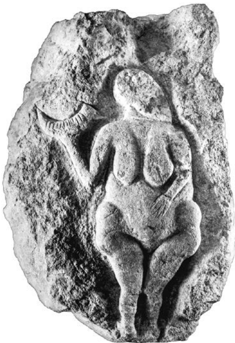
Рис. 6. Венера Лоссельская (рельеф на песчанике, ориньякская культура, юго-запад Франции, 25 000 лет до н. э.)

Отсюда можно сделать интересный вывод относительно всей истории женского начала в мифологии: женщина символизирует саму природу.