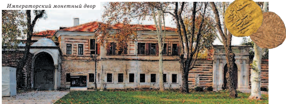
Императорский монетный двор

Нынешнее здание храма Св. Ирины датируется VI в., но ученые выяснили, что ему предшествовало как минимум три строения. Первая христианская базилика была возведена на этом месте на руинах древнего храма Афродиты при римском императоре Константине в IV в. Примечательно, что церковь на протяжении всей своей истории никогда не превращалась в мечеть, поэтому в ней сохранились и атриум (просторное высокое помещение при входе в церковь),