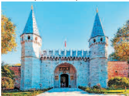
Вход во дворец Топкапы охраняют две башни

Попасть во дворец можно, пройдя через 2 парк Гюльхане. Gulkhāna в переводе с персидского означает «дом роз». Такое название парк получил не случайно: изначально он представлял собой розарий дворца Топкапы. В конце парка высится 3 Готская триумфальная колонна, воздвигнутая еще в III в. в честь победы римских императоров над готами, о чем свидетельствует надпись: «С победой над готами фортуна вновь повернулась к нам». Это древнейший памятник римской архитектуры в городе, дошедший до наших дней. Главная аллея парка ведет на севере к смотровой площадке, откуда открывается великолепный вид на оживленное пространство бухты Золотой Рог, навстречу Босфору. В западной оконечности парка в бывших конюшнях дворца расположился Стамбульский исторический музей исламской науки и техники, открытый в 2008 г. турецким премьер-министром Эрдоганом.