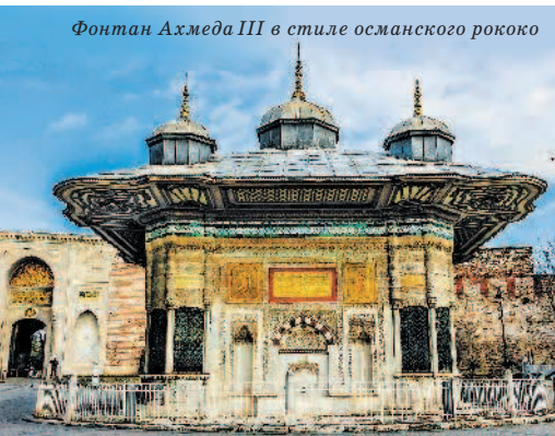
Фонтан Ахмеда III в стиле османского рококо

и большой черный крест, выполненный в технике мозаики на золотистом фоне, и так называемый синтрон (пять рядов сидений, охватывающих апсиду, где во время службы располагалось духовенство). В наши дни помещение церкви используется для проведения концертов.