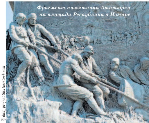
Фрагмент памятника Атаюрку на площади Республики в Измире