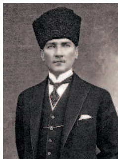
Мустафа Кемаль Атаюрк; Гази Мустафа Кемаль-паша; (1881–1938) – основатель современного турецкого государства

Рим тоже не заставил себя долго ждать. Уже во II в. до н.э. войска Римской республики отправились на завоевания восточных земель. По мере своего продвижения римская цивилизация насаждала свои представления об архитектуре, гигиене, дорогах и праве. Сегодня мы можем наблюдать многие из сохранившихся архитектурных памятников того периода по всей Турции.