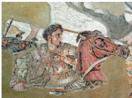
Фрагмент древнеримской мозаики из Помпеи. Александр Македонский (Александр III Великий; 356 г. до н.э. – 323 г. до н.э.) – выдающийся полководец, создатель мировой державы, распавшей после его смерти