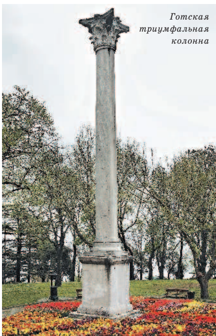
Готская триумфальная колонна