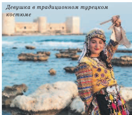
Девушка в традиционном турецком костюме

Турки будут приятно удивлены, если вы употребите всего пару слов на турецком. Например, «Мераба» значит «Здравствуйте». В неформальной обстановке можно использовать «Селям», что переводится как «Привет». Уходя, скажите «Ийи гюнлер», что означает «Всего хорошего». «Спасибо» звучит как «Тешеккур эдерим», а «Пожалуйста» – «Лютфен».