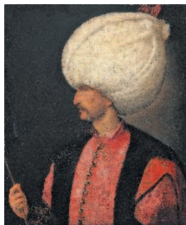
Портрет Сулеймана I Великолепного (Кануни; 1494–1566) – десятый султан Османской империи, и 89-й халиф