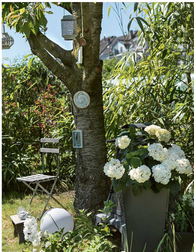
ИСКУССТВО НА ДЕРЕВЕ. НА СТВОЛЕ ВИШНИ ГАБРИЕЛЬ РАЗВЕСИЛА НЕБОЛЬШИЕ КАРТИНЫ И «САДОВЫЕ» ПОСЛОВИЦЫ В РАМКАХ. ОЧЕНЬ ЦЕПЛЯЮЩАЯ ИДЕЯ!

Оно просто необходимо, когда сталкиваешься с сорняками.