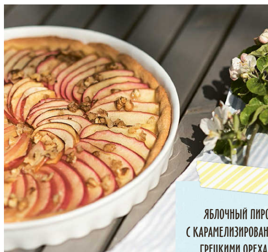
ЯБЛОЧНЫЙ ПИРОГ С КАРАМЕЛИЗОВАННЫМИ ГРЕЦКИМИ ОРЕХАМИ Рецепт на с. 193