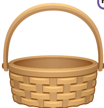
ФРУКТЫ И ЯГОДЫ