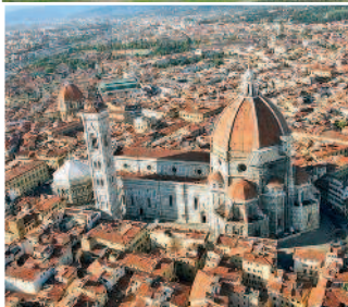
Рим, Колизей Площадь Дуомо во Флоренции Венеция, Гранд-канал