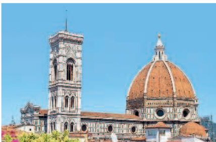
Флоренция, Дуомо и колокольня Джотто

Седьмой день в Милане. Посвятите день шопингу в пафосных брендовых магазинах на улицах Золотого четырехугольника (▷ 78) или в аутлетах за городом.