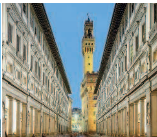
Флоренция, галерея Уффици