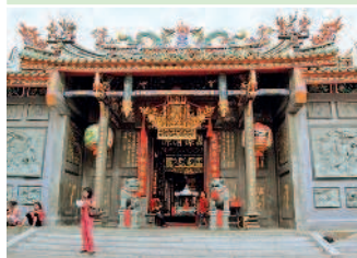
А где-то — и Китая