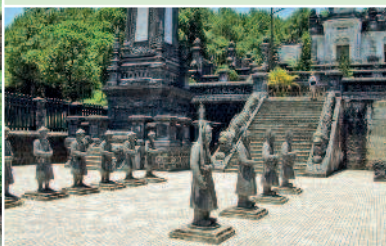
Императорские гробницы, Хюэ