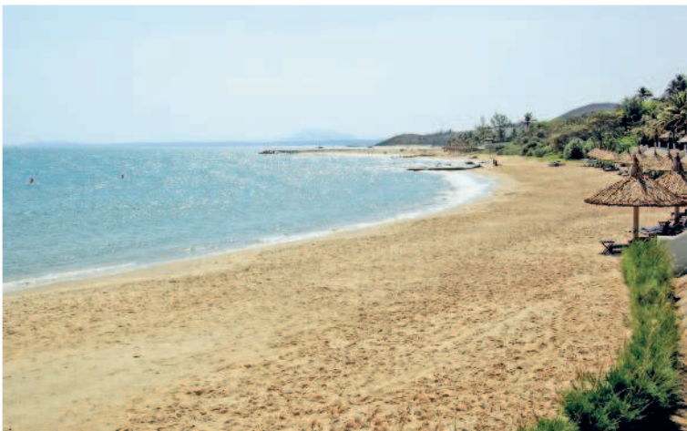
Пляжная полоса Муйне

10-й день. Если время до выезда в аэропорт и знакомство с далатским вином, произошедшее накануне, позволяют, возьмите экскурсию к экзотическим островам в окрестностях Нячанга. Если времени мало, то проведите день на городском пляже. В этот день нужно хорошенько накупаться-назагораться, а особо забывчивым – и пробежаться по сувенирным магазинчикам перед посадкой на самолет.