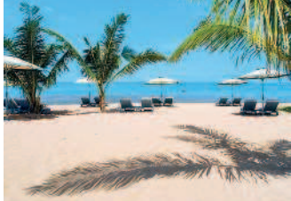
Вьетнам — это песчаные пляжи...