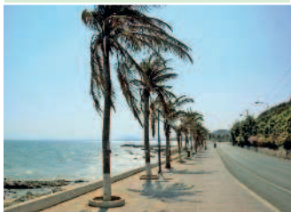
Вьетнам омывается Южно-Китайским морем