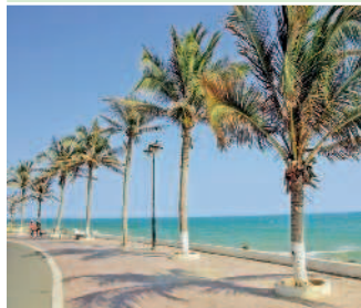
Набережная в курортной зоне Муйне