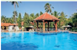
Во Вьетнаме появляется все больше фешенебельных курортов