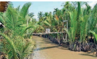
Канал в дельте Меконга

14-й день. Оставшееся перед вылетом время посвятите изучению достопримечательностей Хошимина – посетите музей истории Вьетнама и зоопарк, пагоду Нефритового императора и пагоду Винь Нгием. После столь насыщенной программы десятичасовой перелет наверняка промелькнет для вас как одно мгновение.