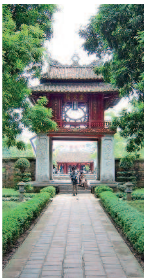
Ханой: храм Литературы

7–8-й день. После ночного переезда вас встречает величественный Хюэ. Один из дней в Хюэ целесообразно посвятить знакомству с достопримечательностями в центре города (в первую очередь стоит увидеть Императорскую цитадель), а на следующий день можно отправиться на осмотр гробниц императоров.