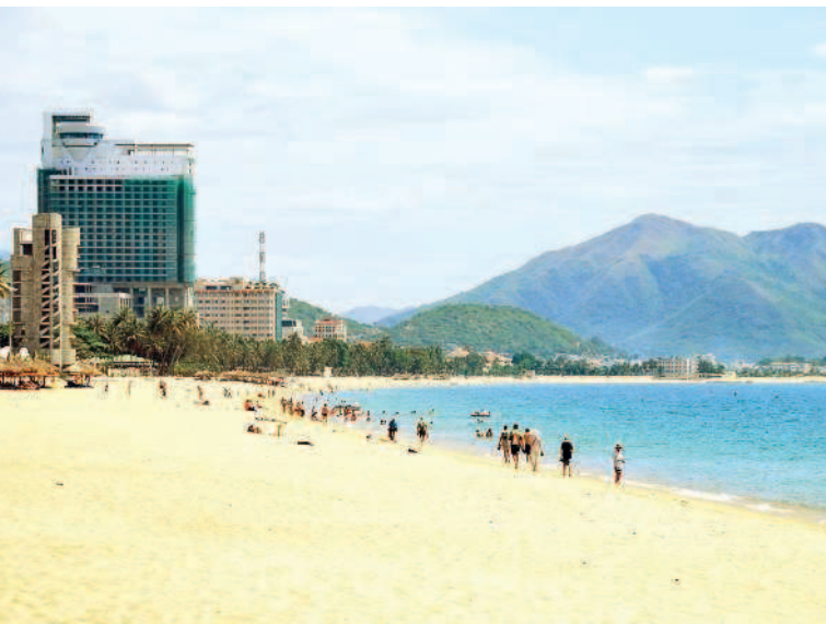
Пляж в Нячанге

10-й день. Перед вылетом стоит наведаться на рынок Dong Xuan Market и побродить часок в его рядах в поисках сувениров, специй, фруктов, футболки с актуальным принтом или чехла для своего iPhone.