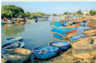
Пейзаж в рыбацкой деревеньке