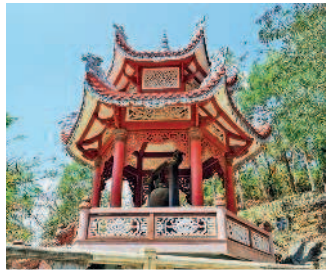
Пагода Лонгшон в Нячанге