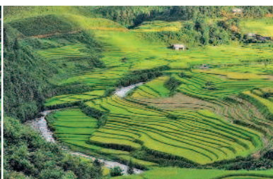
Рисовые террасы Сапы