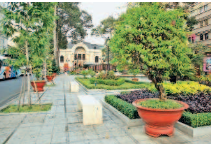
Сквер у Оперного театра в Хошимине