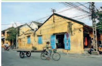
Малозэтажная застройка бывшего портового города