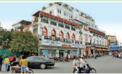
На улицах Ханоя