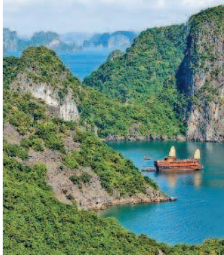
... и горы