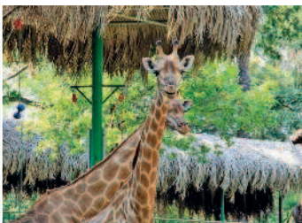
В зоопарке Хошимина