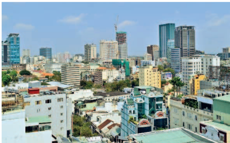
Вид на Хошимин

5-й день. Прощаемся с Хошиминим и выезжаем в город Фантхьет, точнее, в его район Муйне. Здесь вы сможете либо провести пару деньков на пляже, либо взять уроки винд- или кайтсерфинга. А можно заняться