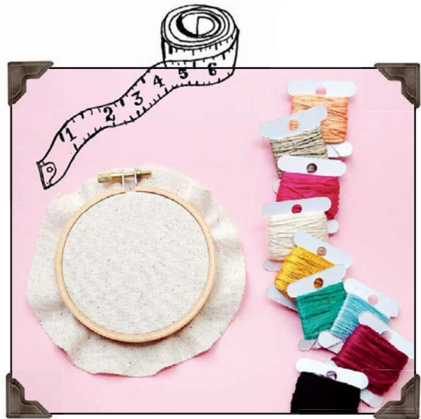
Мои любимые вещи...