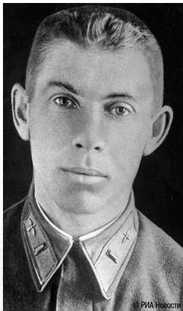
Лётчик, Герой Советского Союза Николай Гастелло.