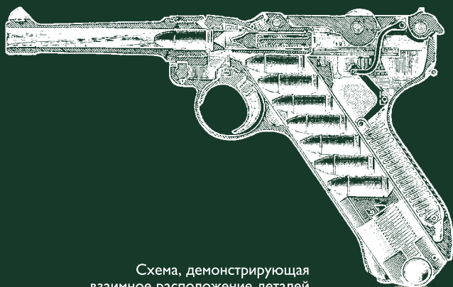
Схема, демонстрирующая взаимное расположение деталей пистолета Р-08 перед выстрелом.

Так как разработки Борхардта так и остались невостребованными, он вскоре возвращается на родину в Германию. Здесь он поступает на работу в фирму «Людвиг Лева и Компани» и приступает к разработке самозарядного пистолета. В ходе этой работы Борхардт знакомится с молодым австрийским инженером Георгом Люгером, который вскоре становится его главным помощником.