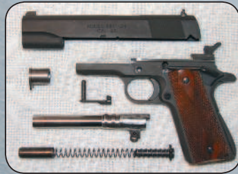
Основные детали (неполная разборка) пистолета M1911.

Пистолет M1911 состоял из трех крупных частей (рамки, ствола и кожуха-затвора) и 53 более мелких деталей. Автоматика работала за счет отдачи при коротком ходе ствола. Однако в отличие от всех предыдущих моделей ствол M1911 был соединен с рамкой пистолета при помощи только одной (качающейся) серьги, расположенной под казенной частью ствола. После выстрела ствол, сцепленный с затвором, двигался назад. При этом серьга поворачивалась на подствольной оси, и казенная часть ствола опускалась. Ствол останавливался, а затвор, продолжая движение назад, выбрасывал использованную гильзу, взводил курок и сжимал возвратную и боевую пружины. Кстати, конструктор нашел для этих пружин очень удачное месторасположение, разместив возвратную пружину под стволом, а боевую — в рукоятке, позади магазина.