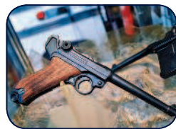
LP-08 — так называемая артиллерийская модель.

Артиллерийский «Парабеллум» имел общую длину 327 мм (длину ствола 200 мм), вес без патронов 1000 г и начальную скорость пули 370 м/с. Он предназначался для вооружения расчетов орудий и младших офицеров пулеметных команд. LP-08 с приставной деревянной кобурой-прикладом позволял вести прицельный огонь на расстояние до 800 м. Емкость магазина была стандартной — восемь патронов, но мог применяться и дисковый магазин системы Леера емкостью 32 патрона.