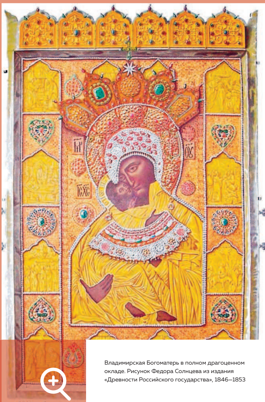
Владимирская Богоматерь в полном драгоценном окладе. Рисунок Федора Солнцева из издания «Древности Российского государства», 1846–1853