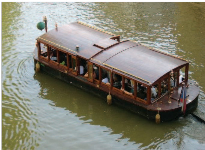
■ Туристический заезд по Влтаве

В Праге повсюду слышишь речь людей из разных стран. И всех она встречает одинаково гостеприимно.